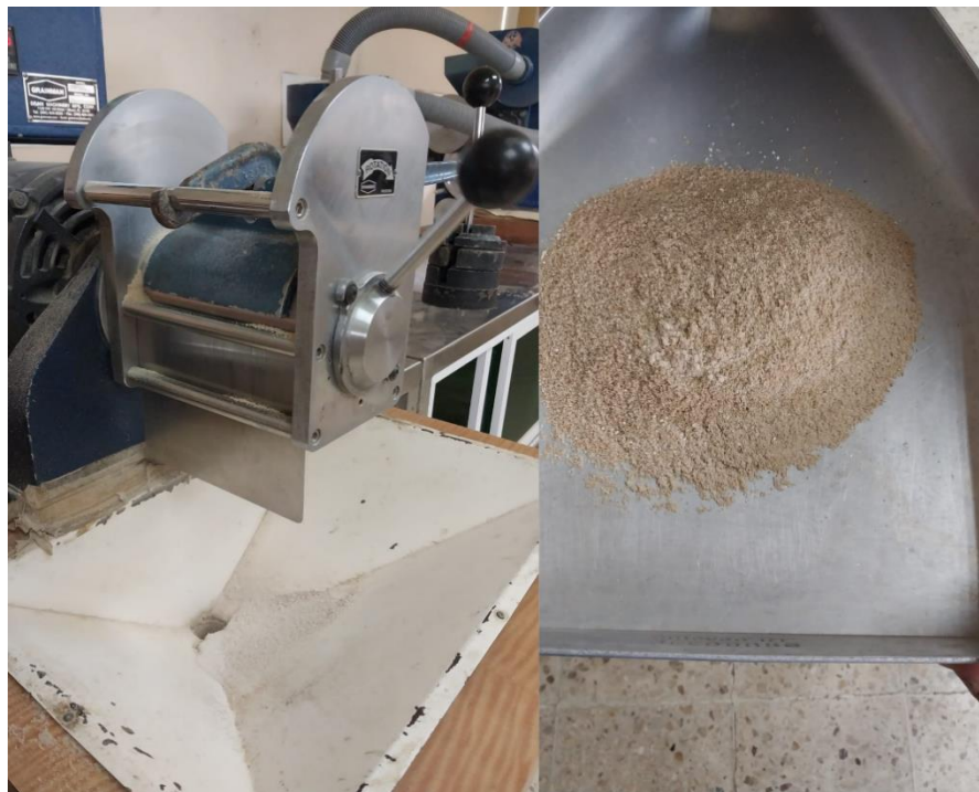
Figura 5 Pulido del grano y polvillo.