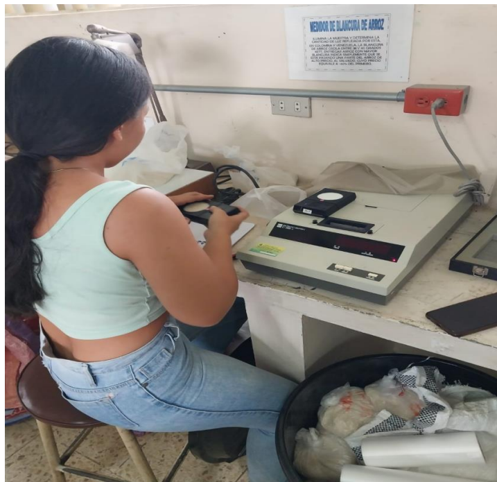
Figura 8 Determinador de blancura.