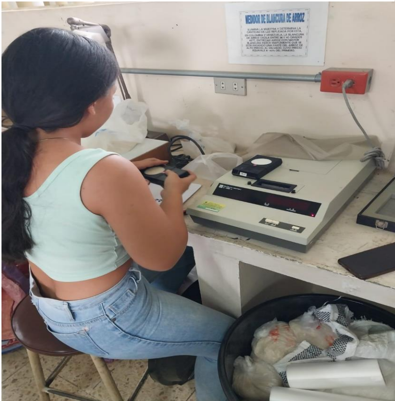
Figura 15 obtención del contenido de amilosa y proteína.