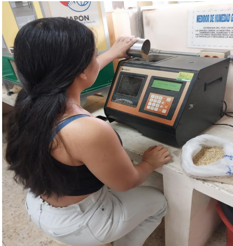
Figura 2 Determinador de humedad.

máximo. Luego se colocó el arroz seco en el determinador de humedad, marca Dicjey Jhon GAC 2100, el valor obtenido es el porcentaje de humedad.