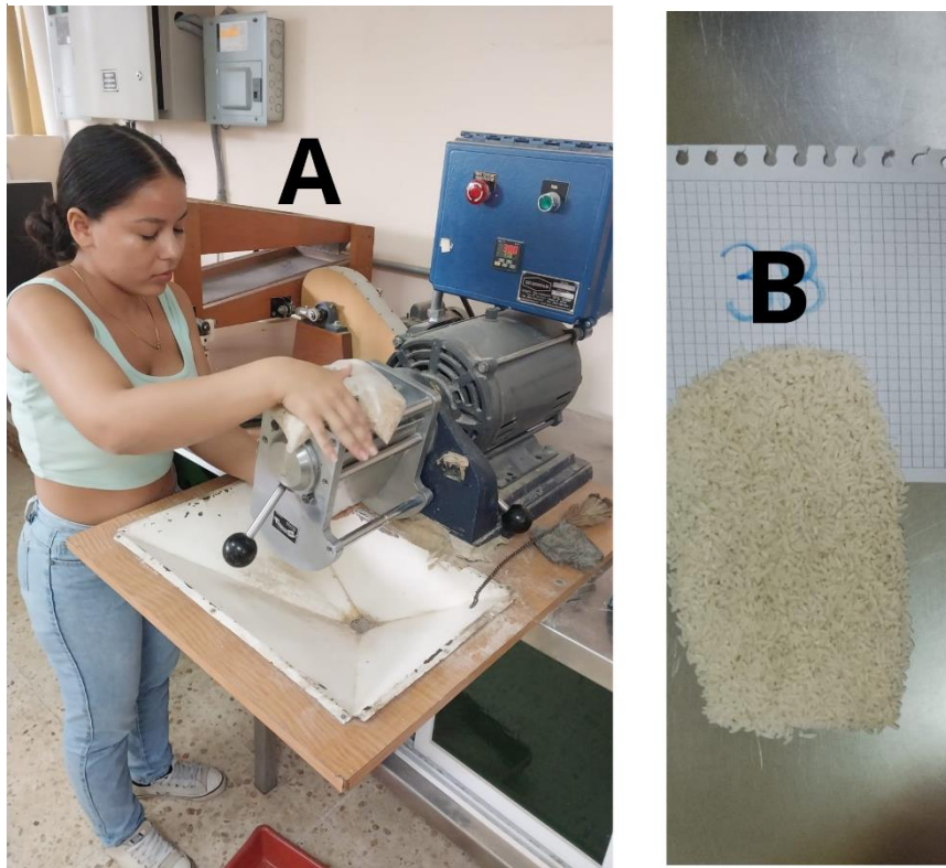
Figura 4 Pulido del grano integral (A); Masa blanca (B).