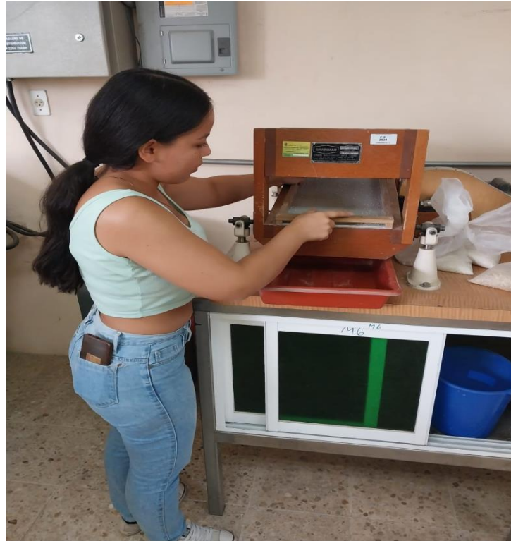
Figura 6 Clasificación de granos enteros y quebrados.