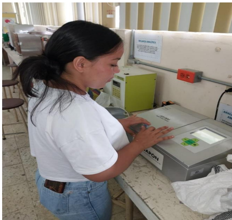
Figura 9 Determinador de proteína y amilosa.

La amilosa y proteína se la determino en maquina AN-900 serie 0F00049, es la que me va a dar los porcentajes de amilosa y proteína que contiene la muestra de arroz.