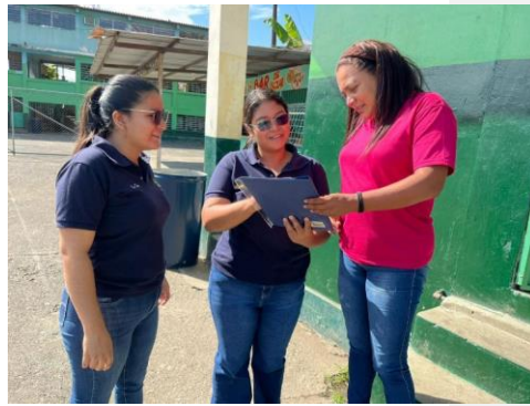
Anexo 6. Entrevista #3 con la docente de 4to año de EGB.