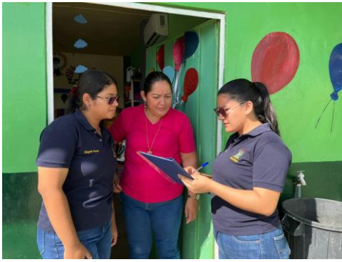
Anexo 5. Entrevista #2 con la docente de 3ero año de EGB.