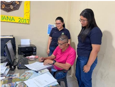
Anexo 1. Socialización con la máxima autoridad de la Institución Educativa