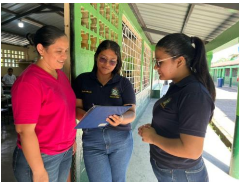
Anexo 7. Entrevista #4 con la docente de 5to año de EGB.