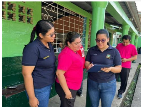
Anexo 8. Entrevista #5 con la docente de 6to año de EGB.