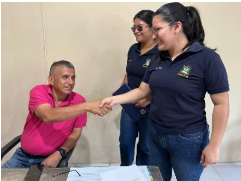
Anexo 3. Agradecimiento y despedida por la atención prestada.