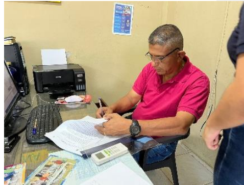
Anexo 2. Firma de carta de consentimiento informado