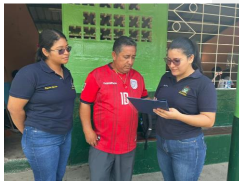
Anexo 4. Entrevista #1 con el docente de 2do año de EGB.