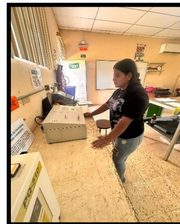
Figura6. Proceso de amilosa y proteínas