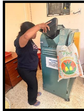
Figura2. Limpieza de impurezas