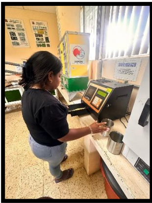
Figura3. Medida de humedad