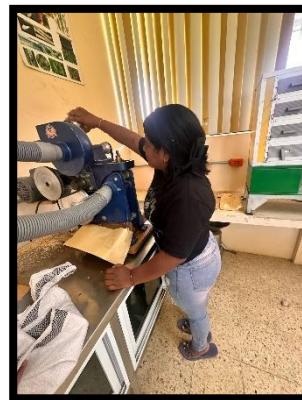
Figura4. Proceso de pulido