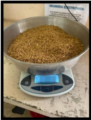
Figura1. Peso inicial