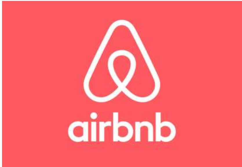
Anexo 2. ¿Cómo reservar dentro de la plataforma Airbnb?