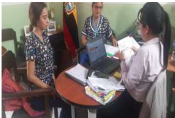
Ilustración 1 Solicitud de permiso para realizar la tesis