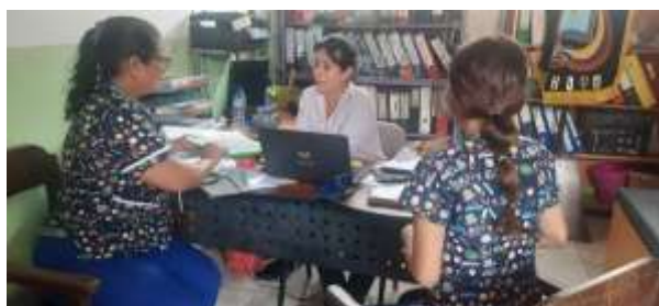
Ilustración 1 Socialización de los datos obtenidos