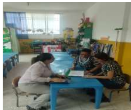
Ilustración 2 Encuesta realizada a la docente de Inicial