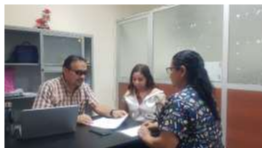
Ilustración 2 Revisión de los documentos por parte del Tutor