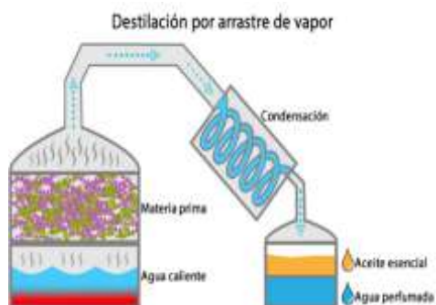
Anexo 5: Destilación por arrastre de vapor