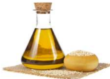
Anexo 2: Aceite de ajonjolí.