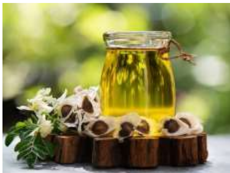
Anexo 1: Aceite de moringa.