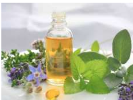
Anexo 3: Aceite de orégano.