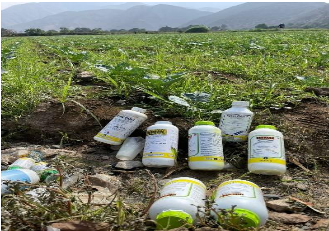
Ilustración 1 Abuso de agroquímicos y sus efectos