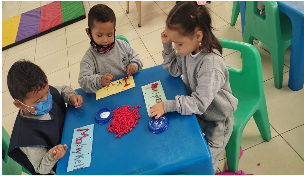
Ilustración: actividades con los niños

Fuente: Unidad Educativa Réplica Eugenio Espejo Elaborado por: Ledesma Tannia y Galarza Melany