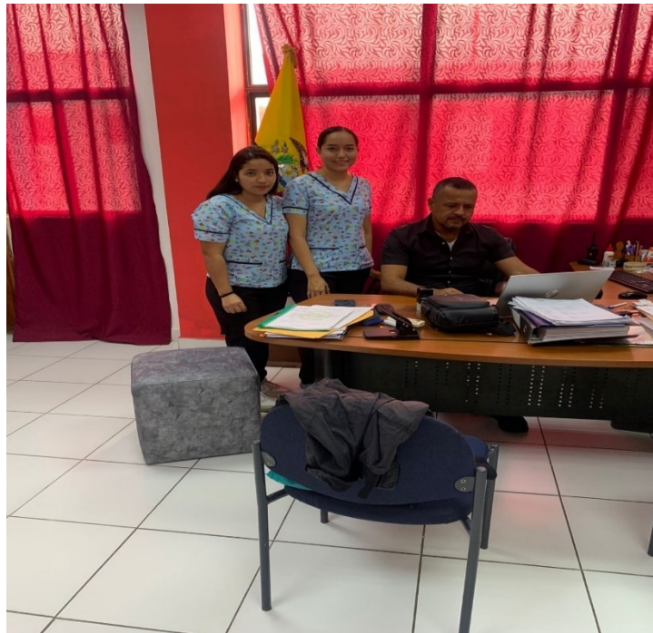
Dialogo con el rector de la Unidad Educativa Réplica Eugenio Espejo