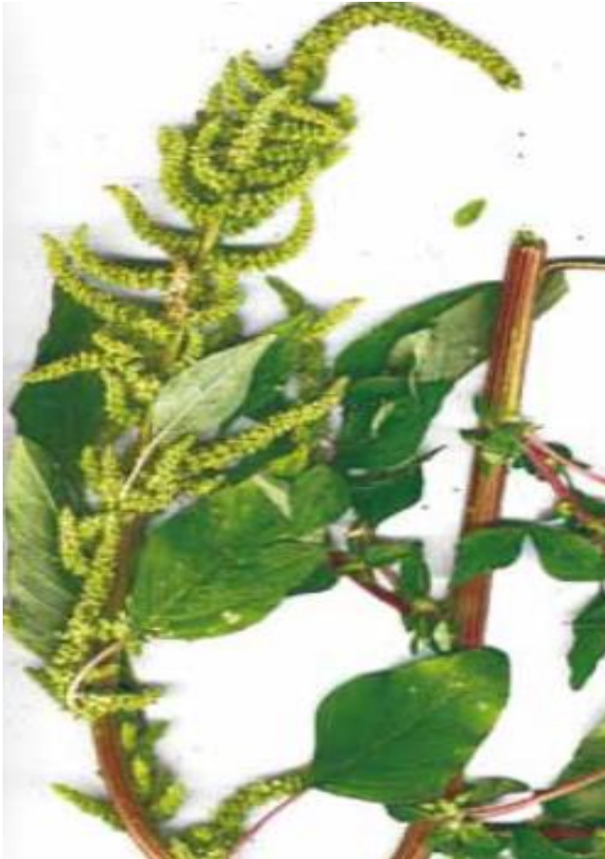
Fig. 6. Amaranthus Spp.