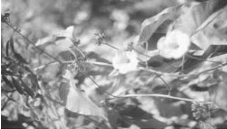
Fig. 5. Ipomoea carnea .