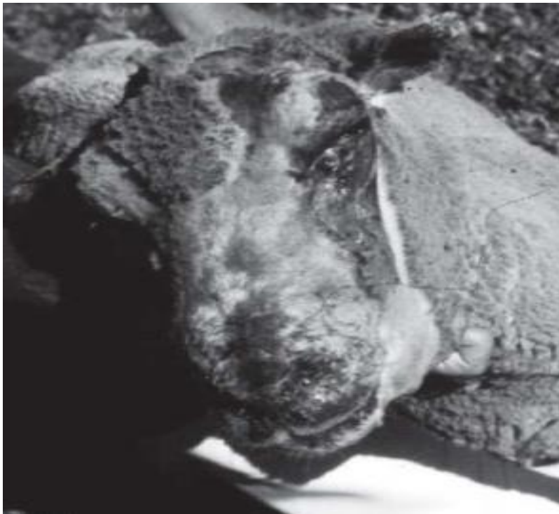
Fig. 8. Secuelas por la ingesta de L. Camara .