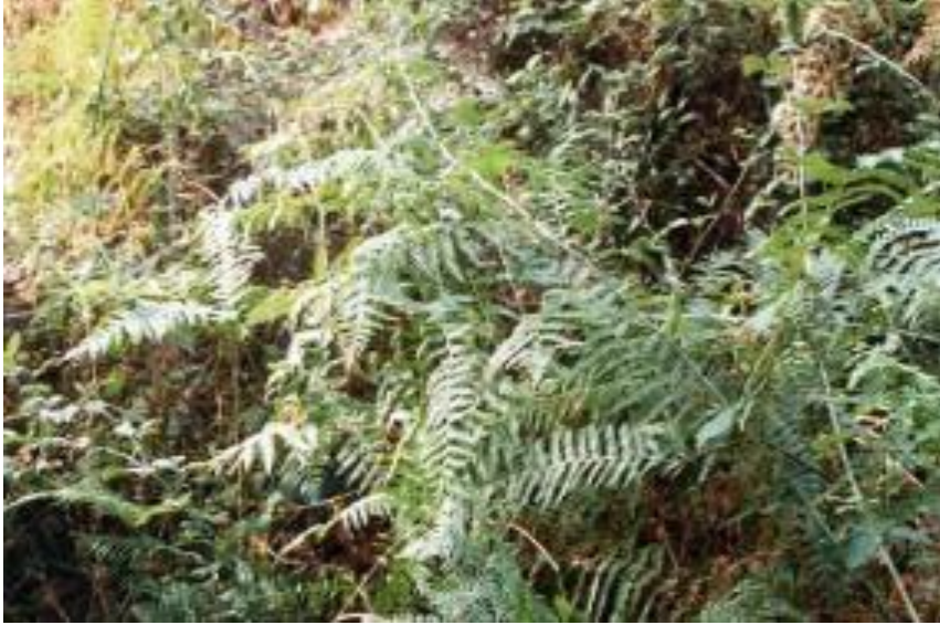
Fig. 9. Pteridium aquilinum .