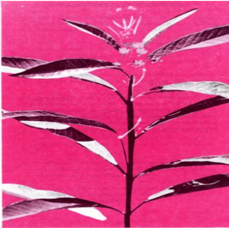
Fig. 1. Asclepias Curassavica .

Fuente: Tomado de Toro y Briones V 1995: 8).