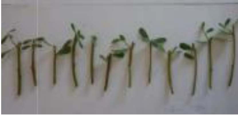
Fig. 7. Portulaca Oleracea .