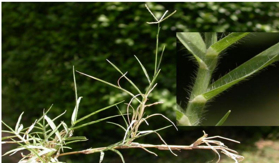
Fig. 2. Cynodon Dactylon .