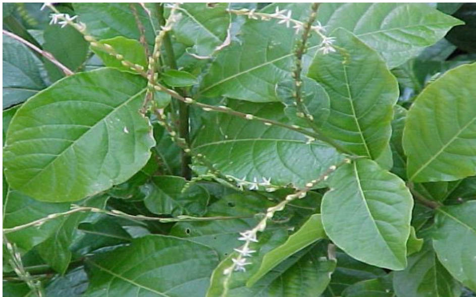
Fig.4. Petiveria Alliacea .