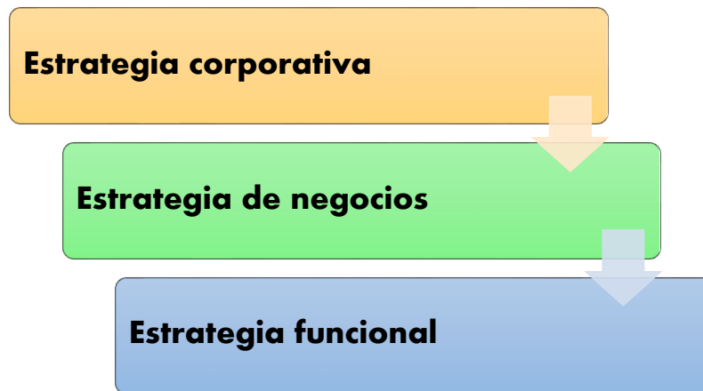
Figura 3: Las estrategias en diferentes niveles organizativos

Las estrategias se las denomina como aquel plan y proceso que se lleva acabo para la promoción especifica de algo. Agregando a lo anterior, existen varias estrategias las cuales permiten de cierta manera llegar al consumidor, sin embargo, todo dependerá el tipo de mercadotécnica o marketing que utilice el que provee la información.