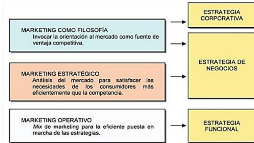
Figura 4: El papel del marketing en la estrategia