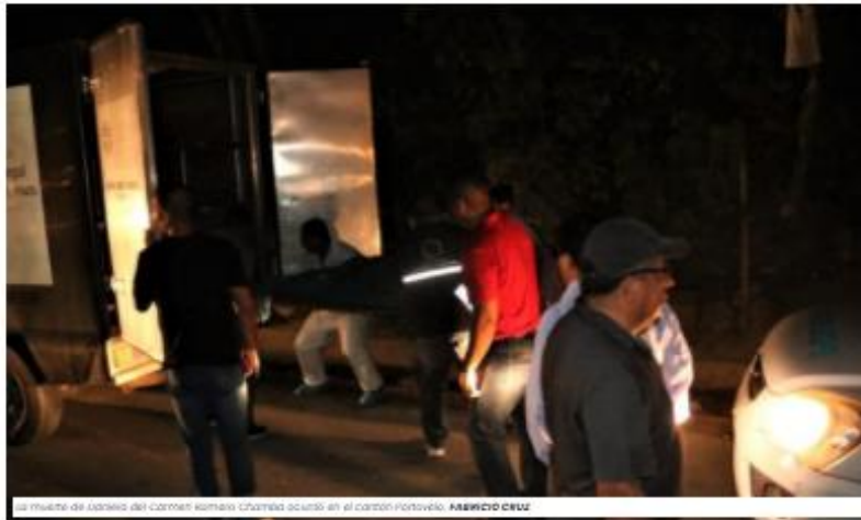
La muerte de Gabriel del crimen conocido llamado ocurrió en el cantón Portovelo. FABRICO CRUZ