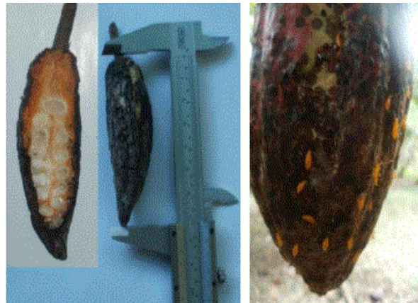
Fig. 1 ( Monalonia dissimulatum Dist)

picadura. Las mazorcas atacadas presentan manchas necróticas circulares de aproximadamente 4mm. El fruto puede ser atacado en cualquier edad, sin embargo, frutos jóvenes de siete a 12 semanas y de 10 a 12 cm, se tornan negros, se endurecen y mueren. Aparentemente, la disminución de las lluvias coincide con el aumento de las poblaciones, también la sombra deficiente tiene influencia sobre su desarrollo.(INIAP 2014)