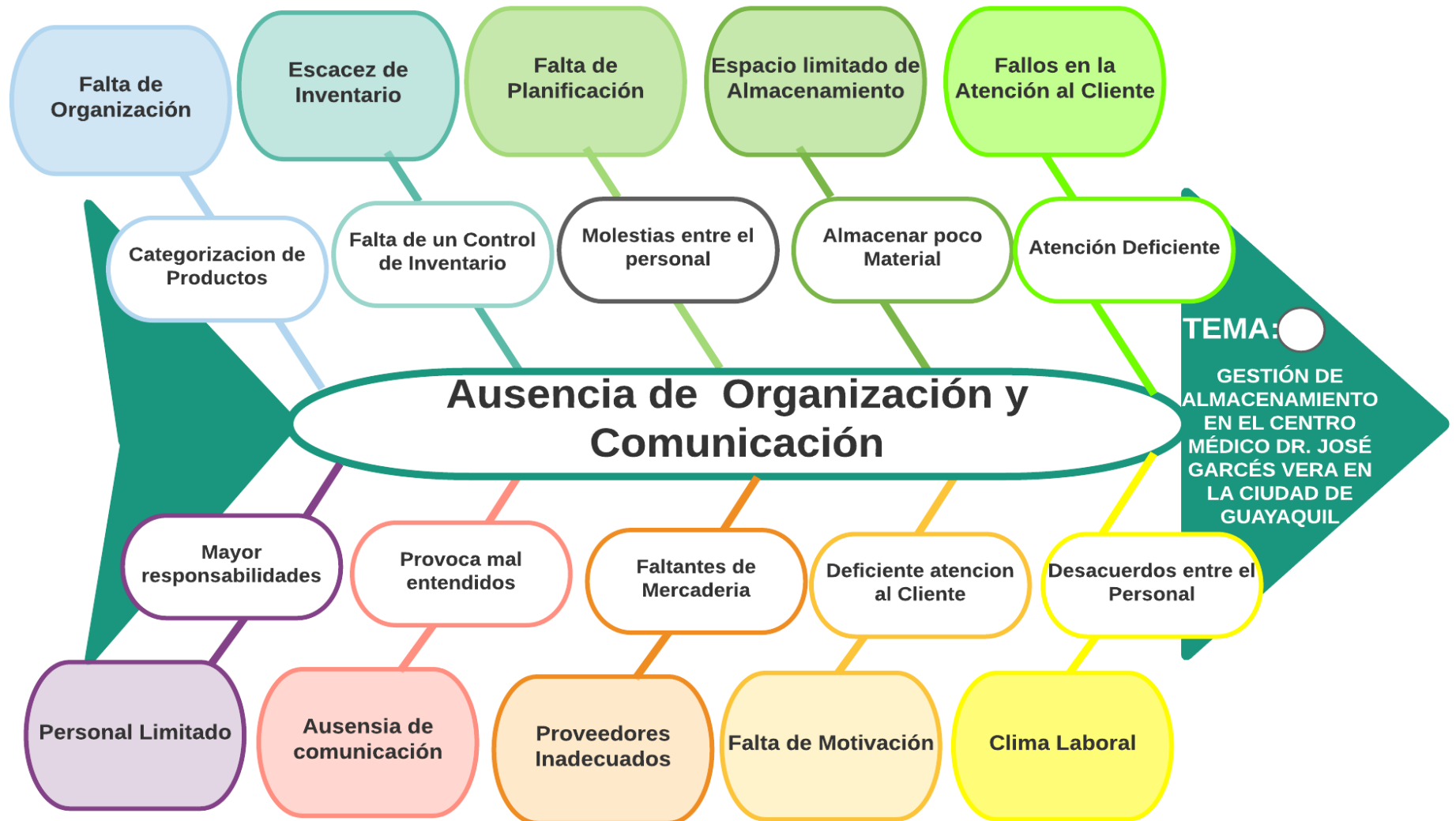
DIAGRAMA DE ISHIKAWA