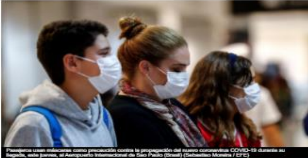
Pasejeros usan máscaras como precaución contra la propagación del nuevo coronavirus COVID-19 durante su llegada, este jueves, al Aeropuerto Internacional de São Paulo (Brasil).

• Coronavirus, última hora en directo | Confirmados 51 casos de Covid-19 en España