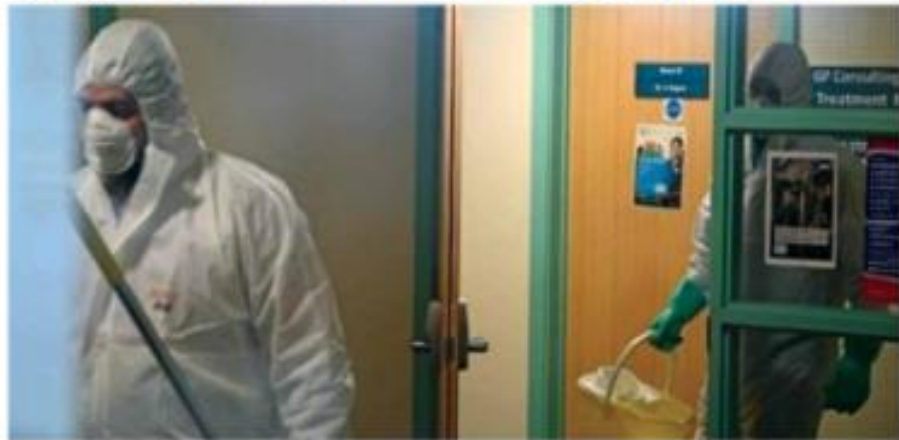
PANORAMA. El cuerpo de la mujer fallecida llega hoy a Babahoyo, donde será sepultado.

Ecuador está en emergencia sanitaria por 60 días y por eso se han prohibido los eventos masivos que superen las 250 personas, se suspendieron las clases