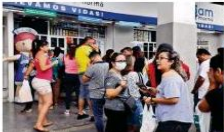
El caso de coronavirus se dio en un comercio y se dio a conocer a través de un caso de un paciente que se enfermó.

Se activan los protocolos El gobernador de Bordenabueno, Juan Carlos Borja, anunció que se activaron los protocolos de contingencia por un caso de coronavirus en un comercio de Babahoyo.