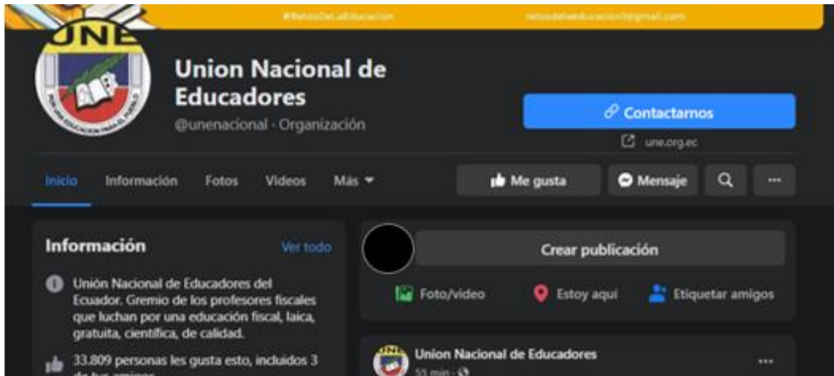
Gráfico 6. Reducción de salario -Unión Nacional de Educadores

de esta agrupación se ejecutó, según Peralta (2020) debido a la “reducción de la jornada laboral de una hora, que representa el 8.3% menos de su sueldo mensual”. Puesto argumentan que la reducción laboral no es cierta, porque dentro de casa se trabaja más. Por lo que declaran que esta reducción de una hora no se cumple por ende la reducción salarial es injusta.