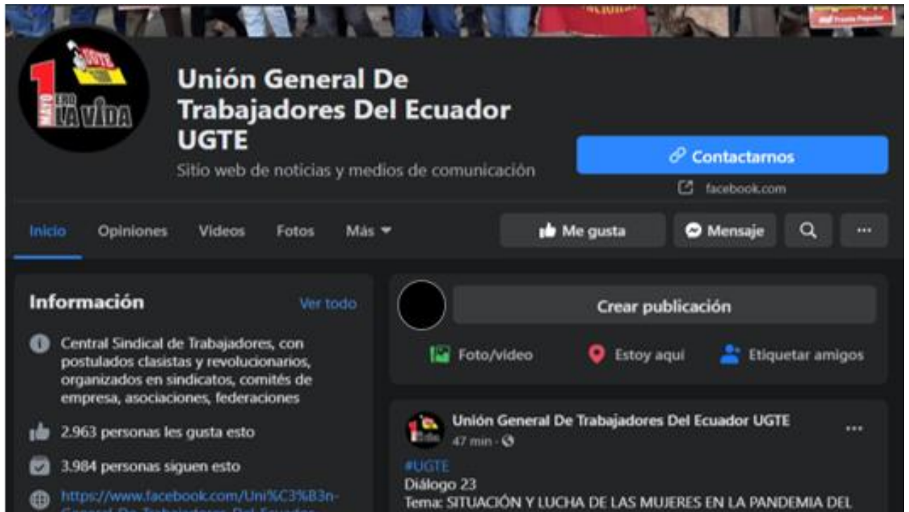
Gráfico 7. Reducción de salario- UGTE

federaciones, con el propósito de luchar por los derechos de los trabajadores ecuatorianos que el código del trabajo les otorga.