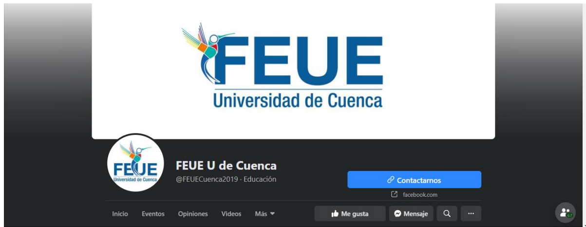
Gráfico 1. Perfil de grupo por reducción de presupuesto de las universidades estatales- FEUE

En el análisis de contenido de perfil de Facebook del Frente Unitario Universidades Estatales (FEUE) de Cuenca, se encontró lo siguiente: