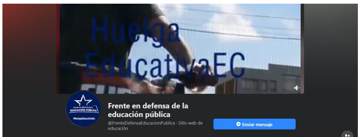
Gráfico 3. Protesta por reducción de presupuesto de las Universidades Estatales- Frente en Defensa de la Educación Pública

El frente de defensa de la educación surge como una necesidad de la comunidad educativa del país de contar con un espacio orgánico. Político y de acción que posibilite expresar y ejercer el libre derecho a resistir y enfrentar la Ley de Apoyo Humanitaria