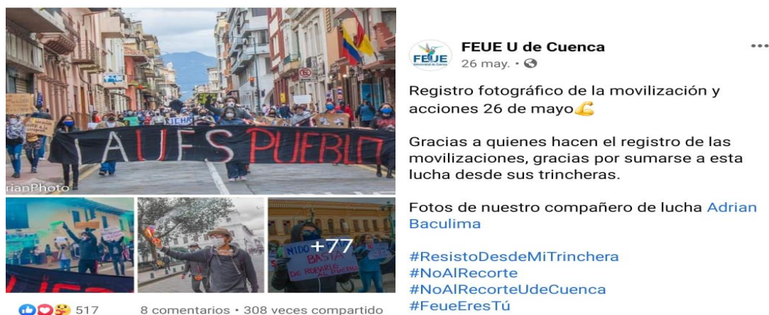
Gráfico 2. Protesta por reducción de presupuesto de las universidades estatales- FEUE de Cuenca