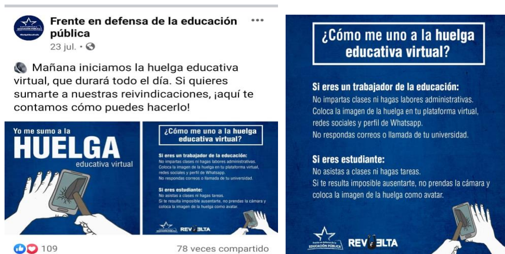
Gráfico 4. Protesta por reducción de presupuesto de las Universidades Estatales- Frente en Defensa de la Educación Pública

Los diseños gráficos son los más utilizados para informar hora, fecha y día de los plantones Los videos también fueron, utilizados en donde los universitarios grababan su voz de protesta la cual la denominaban “VOCES DE LA HUELGA” y dentro de este medio lo difundían