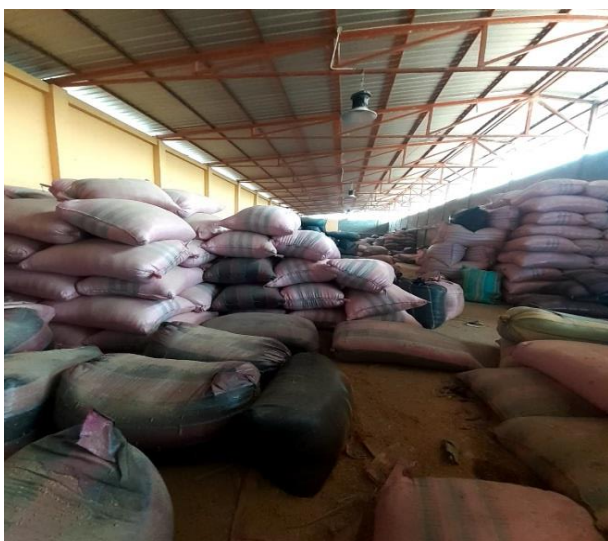
Fotografía 3: Deposito de arroz en bodega