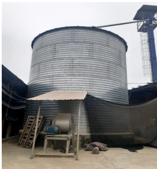
Fotografía 2: Depósito de arroz en silos