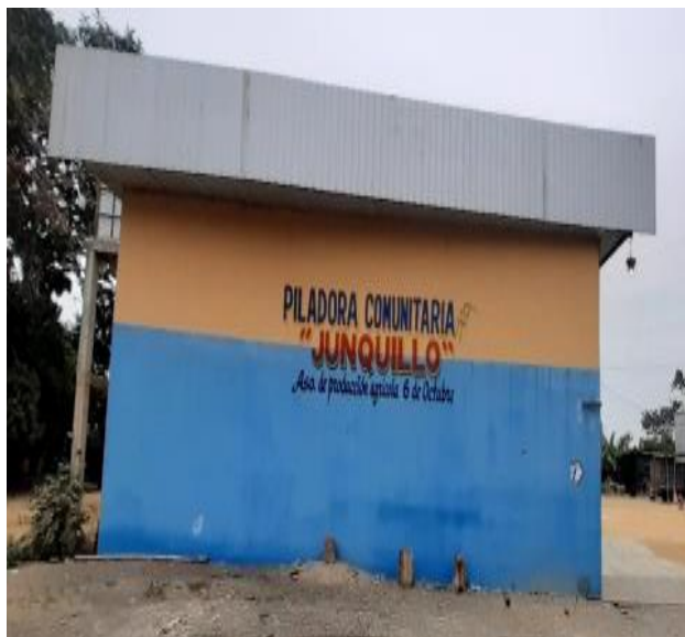
Fotografía 1: Sede de ASOPROAGROC