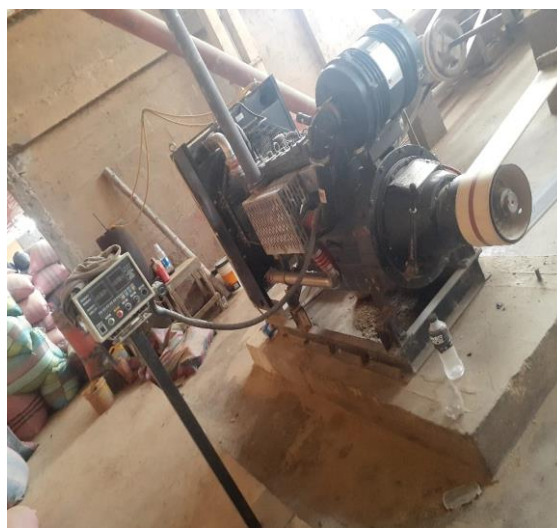
Fotografía 4: Maquinaria para procesar productos agrícolas