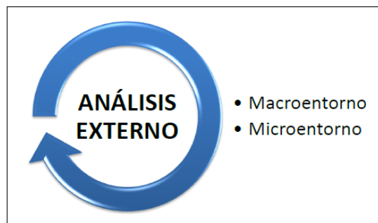
Figura 1. Análisis Externo

El análisis externo debe realizarse a través de dos contextos amplios como el macroentorno y el microentorno.