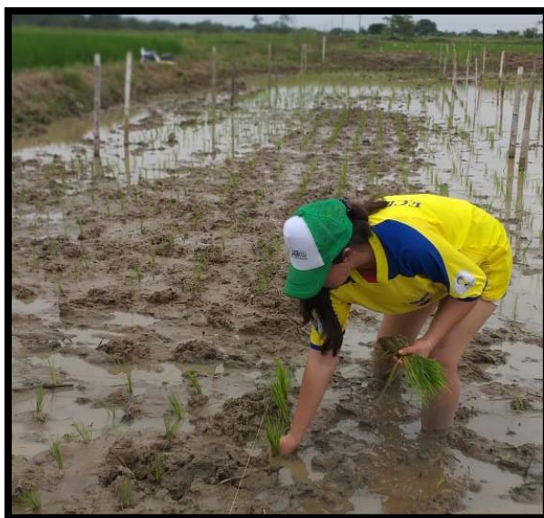
Figura 2. Trasplante del experimento.