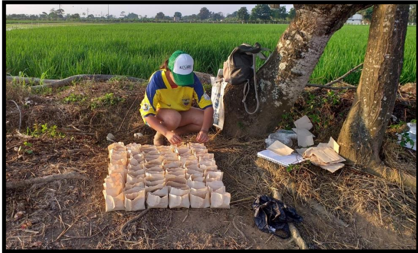
Figura 3. Dosificación de tratamientos.