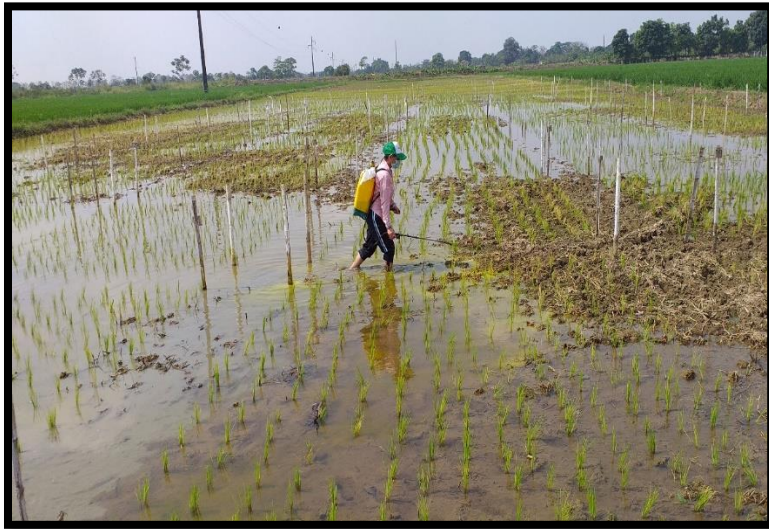
Figura 4. Aplicación de herbicidas.