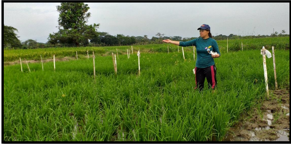
Figura 5. Fertilización edáfica.