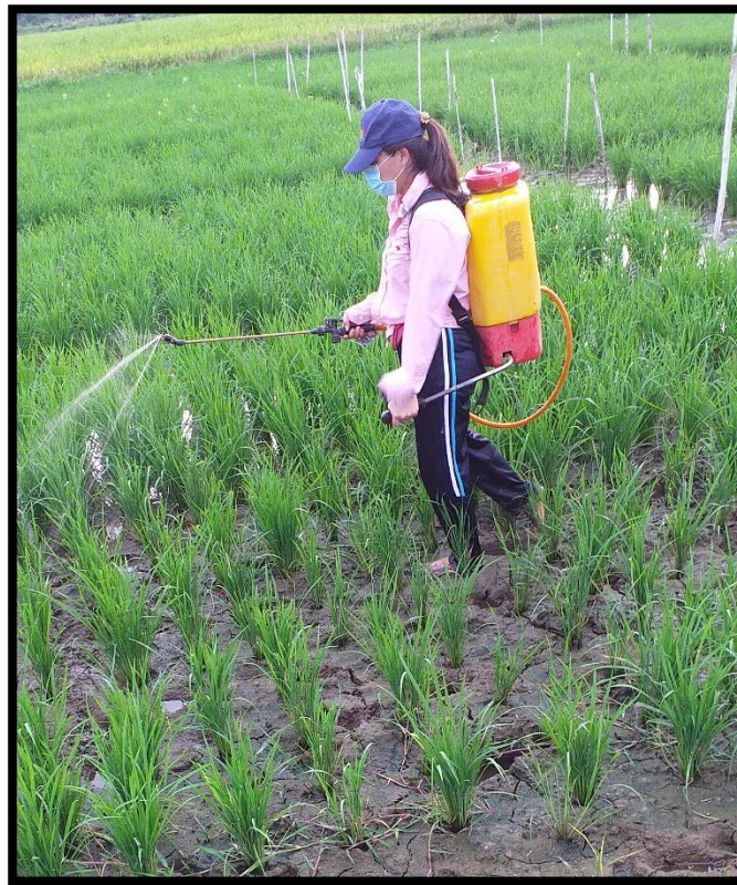
Figura 6. Aplicación de insecticidas.