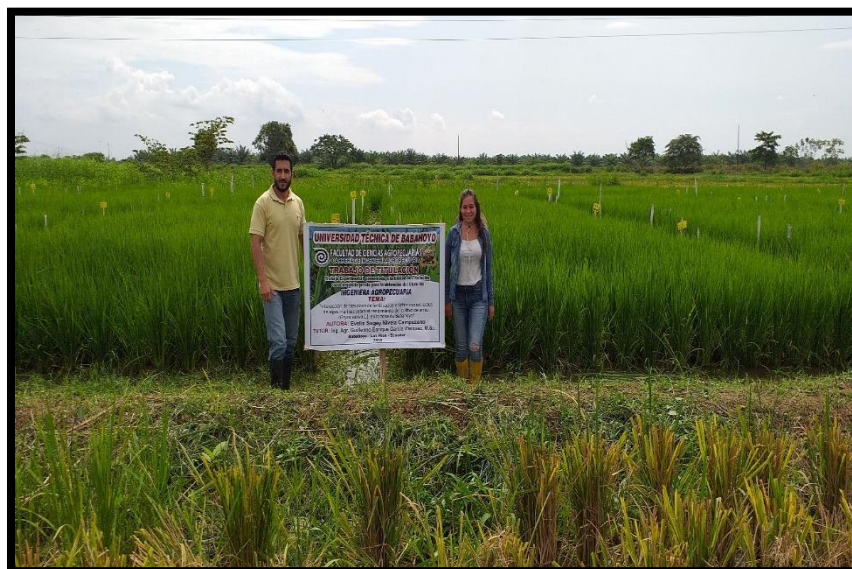
Fig 11. Visita del miembro de la Unidad de Titulación.