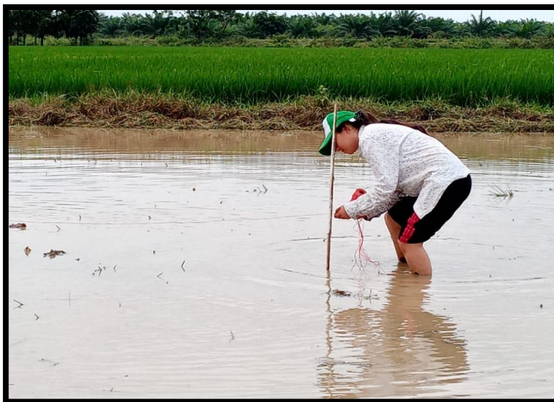
Figura 1. Estaquillado del terreno.