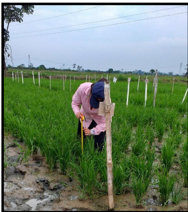
Figura 8. Evaluacion de altura de planta.