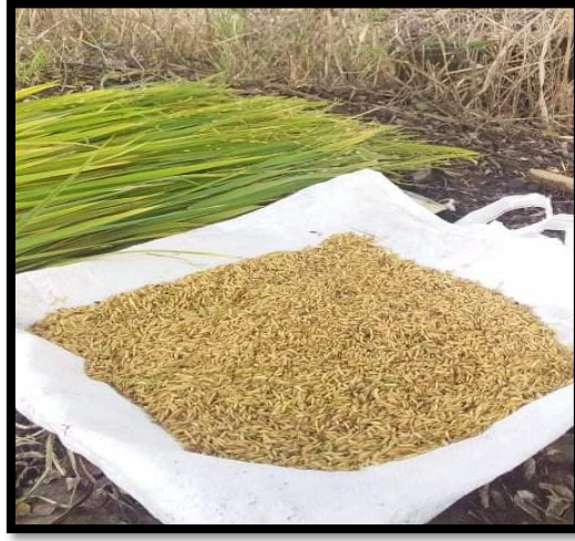
Fig 13. Cosecha del área experimental