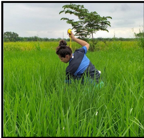
Fig. 10. Toma de dato altura de planta los 40 días después del trasplante