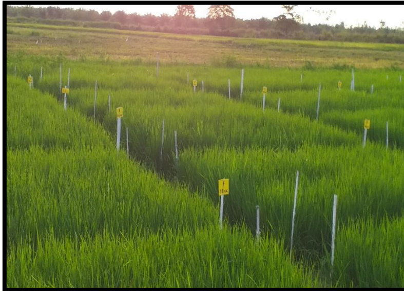
Fig 9. Cultivo de arroz a los 53 días después del trasplante.