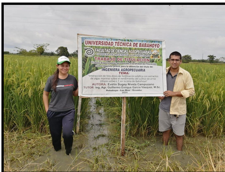
Fig 12. Visita de tutor.