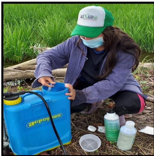
Figura 7. Dosificaciój de tratameitnos.