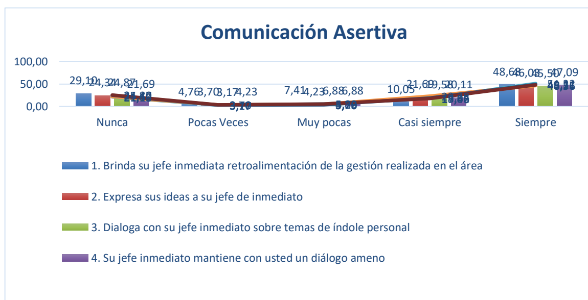
Gráfico 1. Muestra para pruebas estadísticas de la Comunicación Asertiva aplicada al Personal Administrativo.