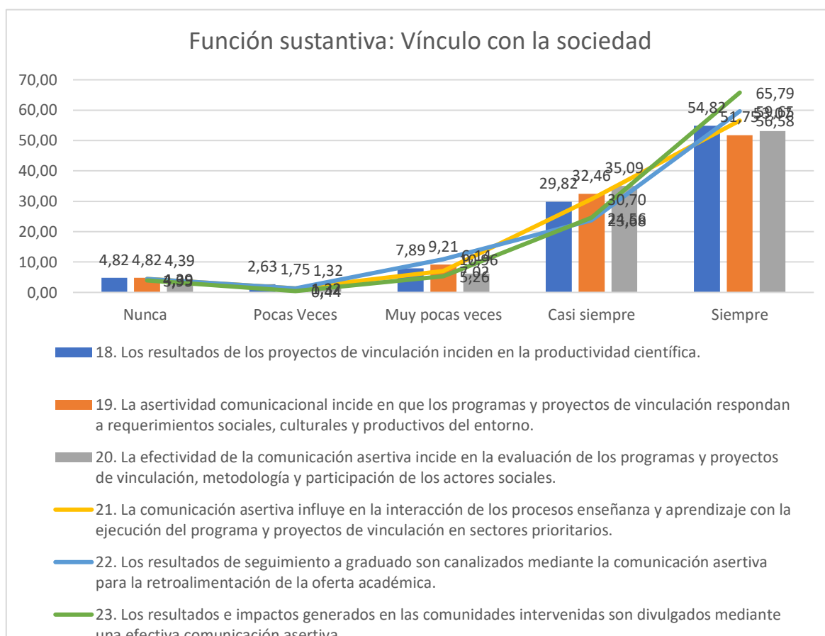
Gráfico 4. Muestra para pruebas estadísticas de la Función Sustantiva Vínculo con la sociedad Aplicada a docentes.