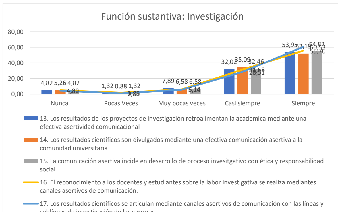
Gráfico 3. Muestra para pruebas estadísticas de la Función Sustantiva Investigación aplicada a los docentes.