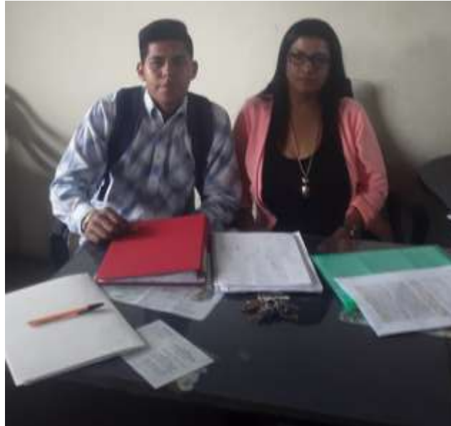
Figura 7: solicitando permiso a la rectora de la unidad Educativa Pueblo Nuevo

Si trata sobre los riesgos informáticos, pero no se ha trabajado con ella en ninguna ocasión.