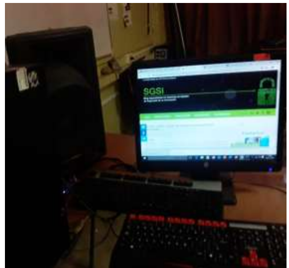
Figura 9: Pc principal del laboratorio de cómputo de la UEPN.