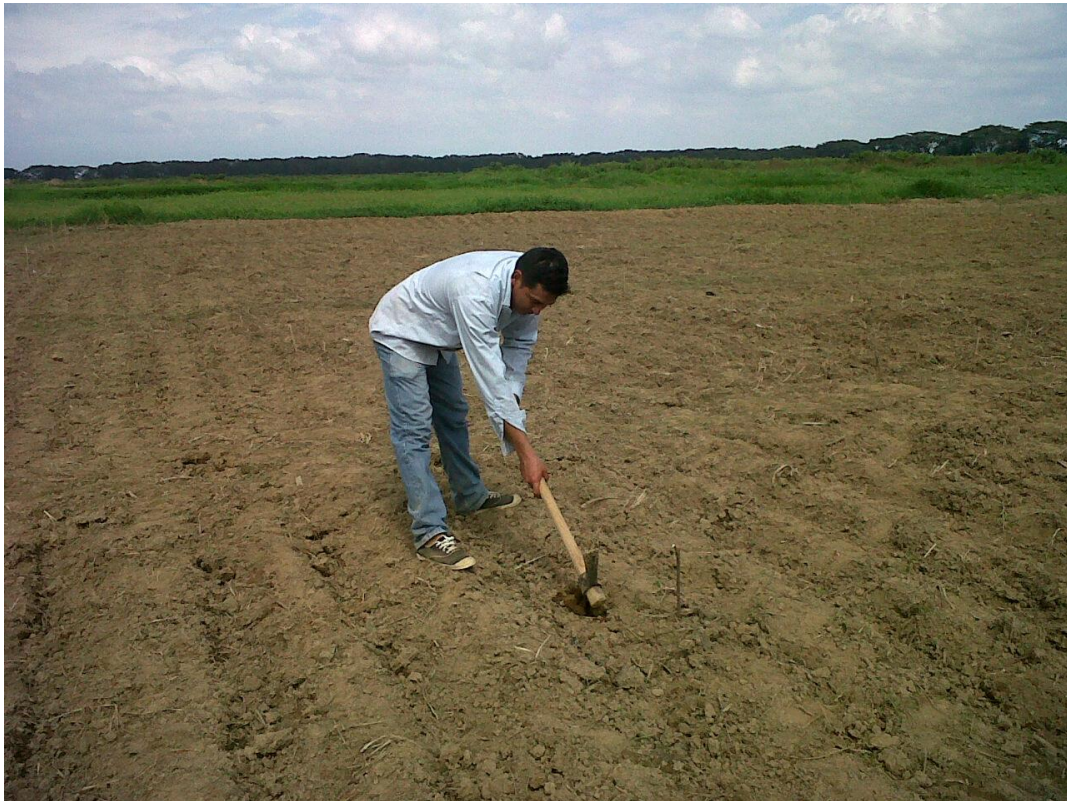
Figura 2. Surcos para depositar la semilla