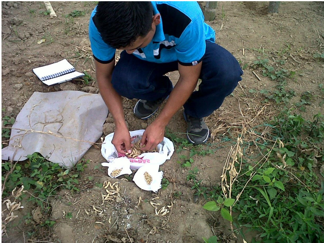
Figura 12. Peso de 100 semillas