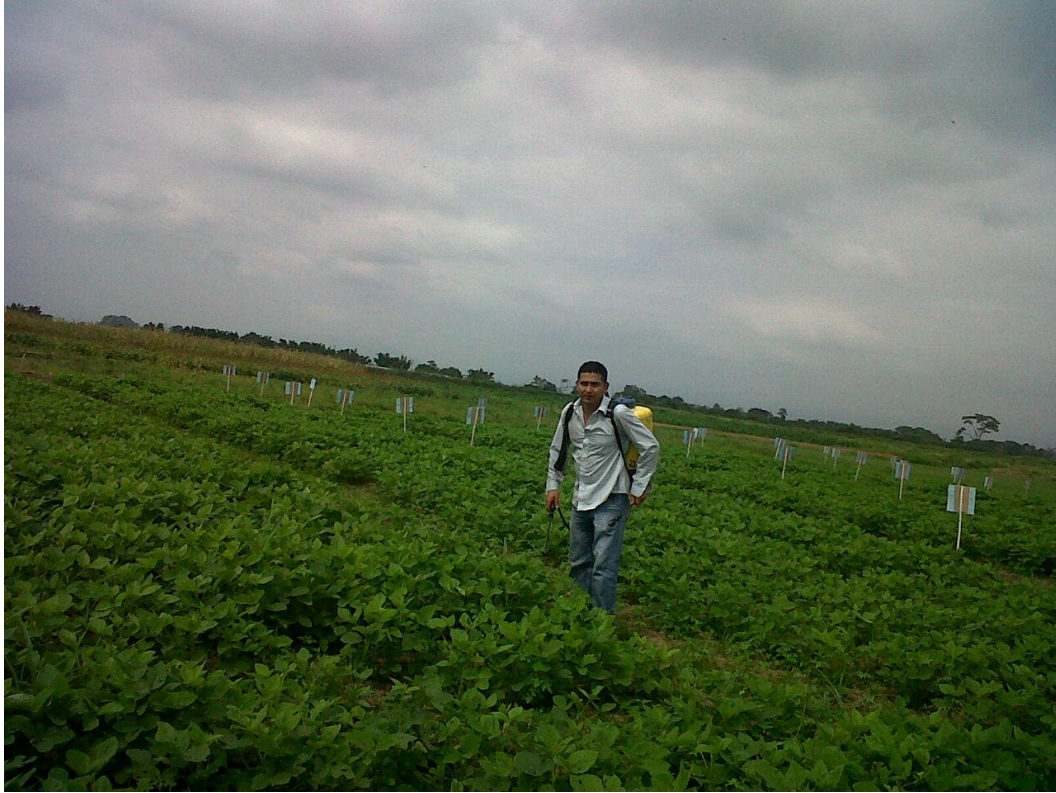
Figura 5. Aplicación de fertilizantes foliares en dosis de acuerdo al sub-tratamiento