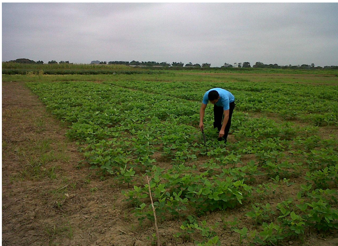
Figura 4. Control de maleza manual