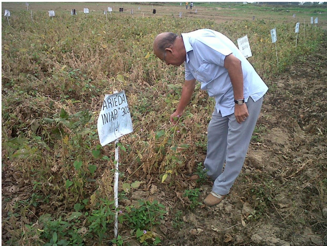
Figura 8. Segunda revisión del tutor académico