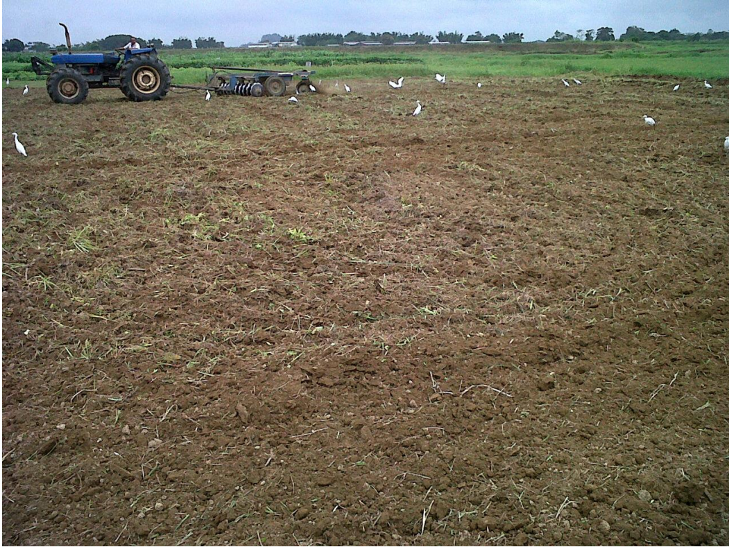
Figura 1. Preparación de Suelo