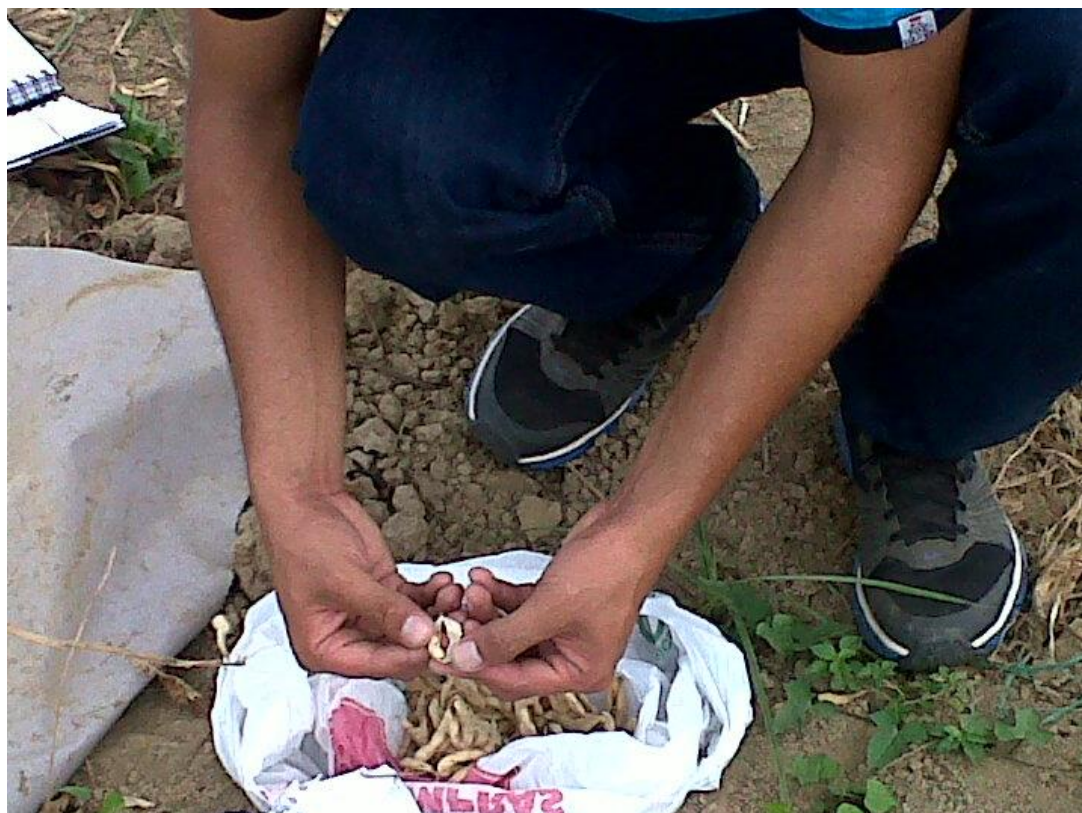
Figura 10. Numero de grano por vaina