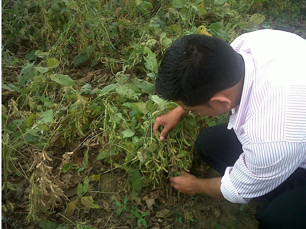
Figura 11. Numero de vainas por planta