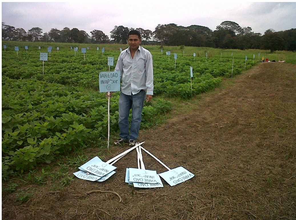
Figura 3. Colocación de carteles para identificar los sub-tratamientos según su nivel de fertilizantes