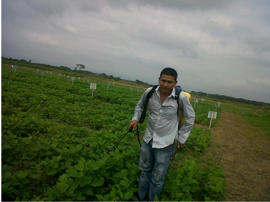
Figura 7. Aplicación de insecticidas y fungicidas para el control de plagas y enfermedades