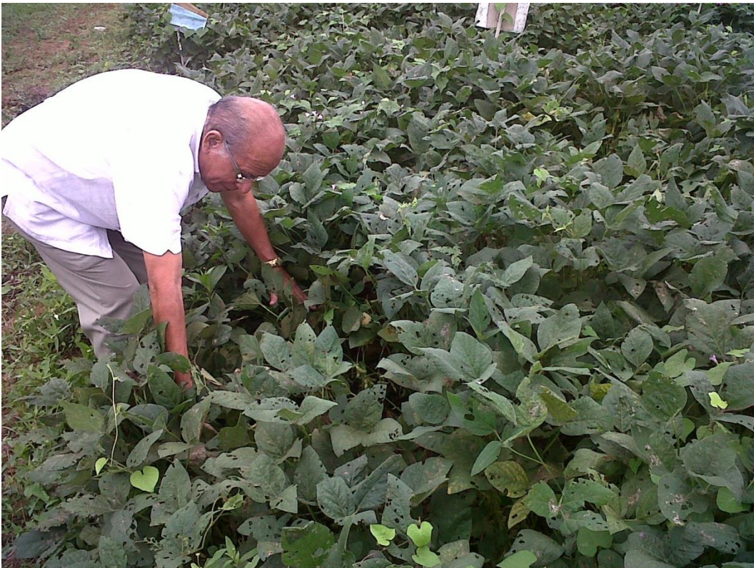
Figura 6. Primera revisión del tutor académico