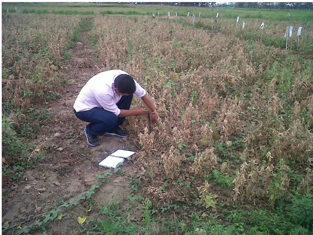
Figura 9. Toma de datos.- altura de planta