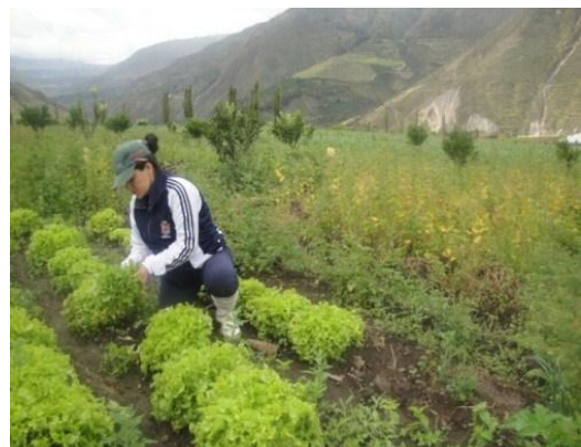
Imagen 12: Días a la cosecha