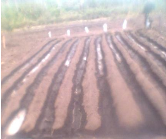
Imagen 7: Riego