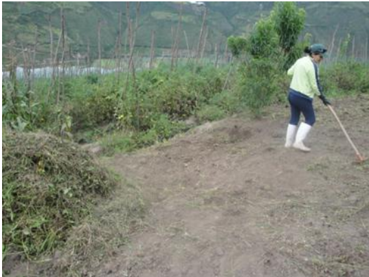
Imagen 1: Preparación del suelo