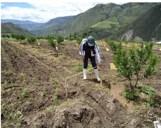
Imagen 5: Delimitación de parcelas