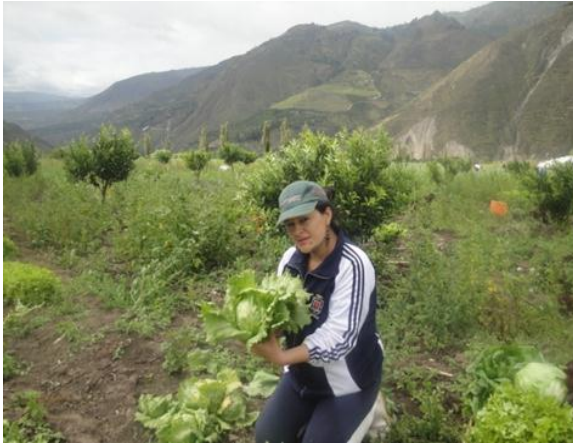
Imagen 13: Peso de repollo (kg)