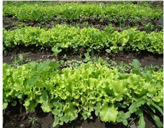
Imagen 8: Control de malezas