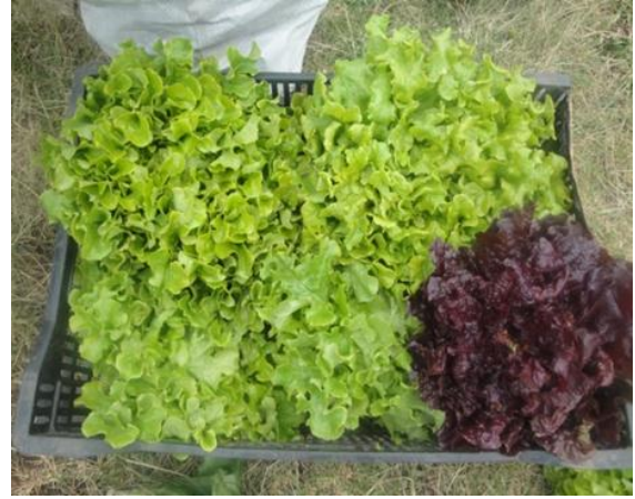
Imagen 14: Peso de repollo (kg)