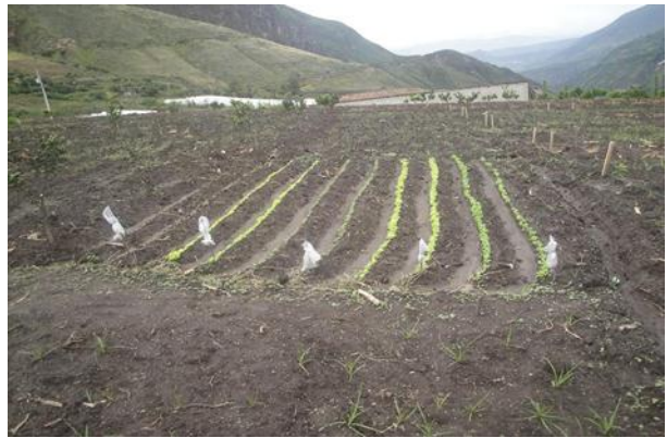
Imagen 2: Elaboración de semilleros