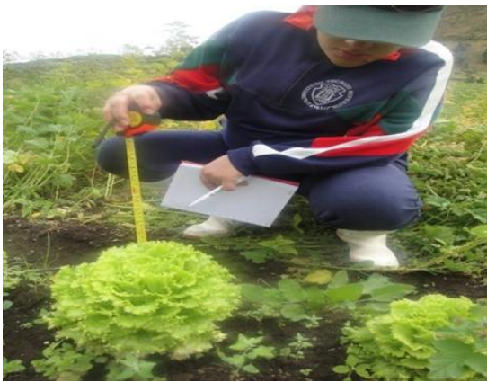
Imagen 9: Variable altura de planta 60 días