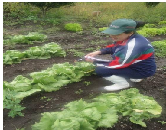
Imagen 10: Ancho de hojas