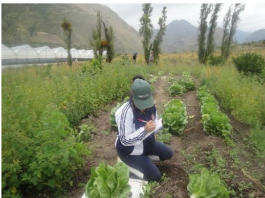
Imagen 11: Longitud de hojas