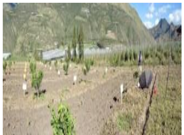
Imagen 6: Delimitación de parcelas