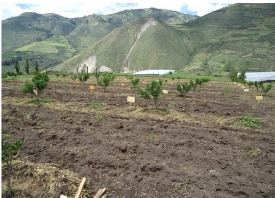
Imagen 3: Delimitación de parcelas