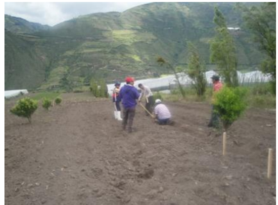
Imagen 4: Delimitación de parcelas