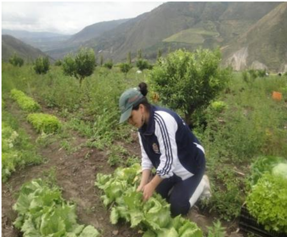
Imagen 15: Cosecha