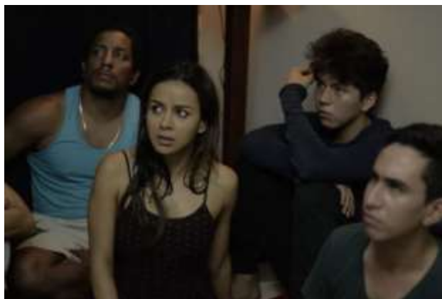
Figura 2: Fotograma del largometraje Nice Guy Julio: Los integrantes son amenazados