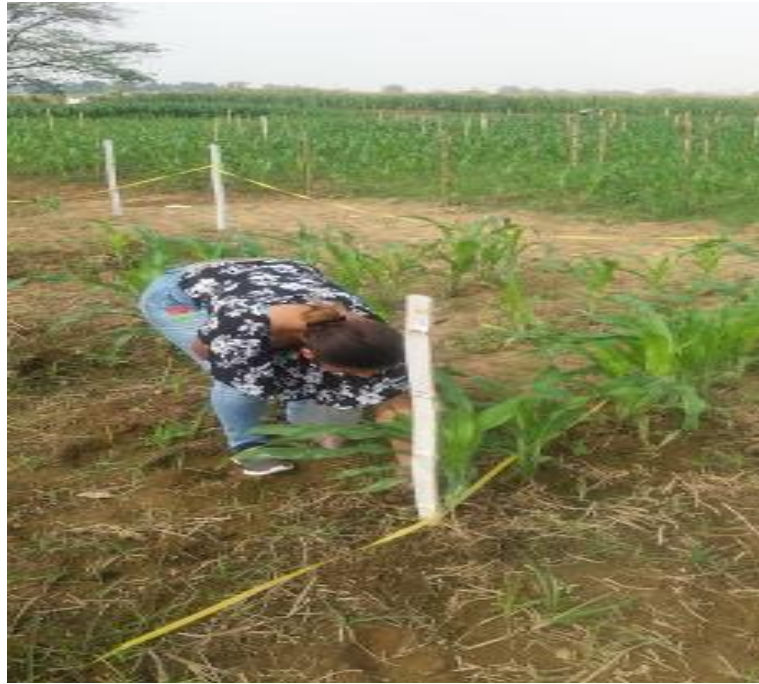
Figura 3. Aplicación de tratamientos.