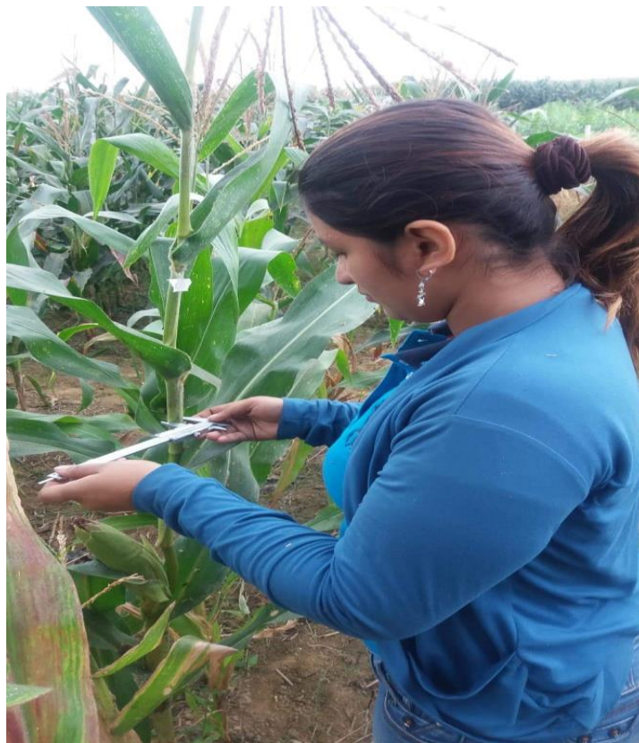
Figura 8. Evaluación de diámetro del tallo.