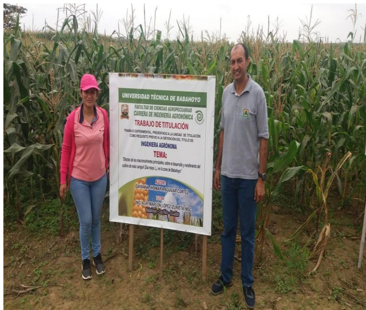
Figura 6. Visita del tutor del trabajo experimental.