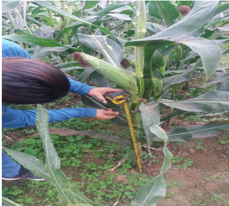
Figura 7. Evaluación de altura de inserción de mazorca.