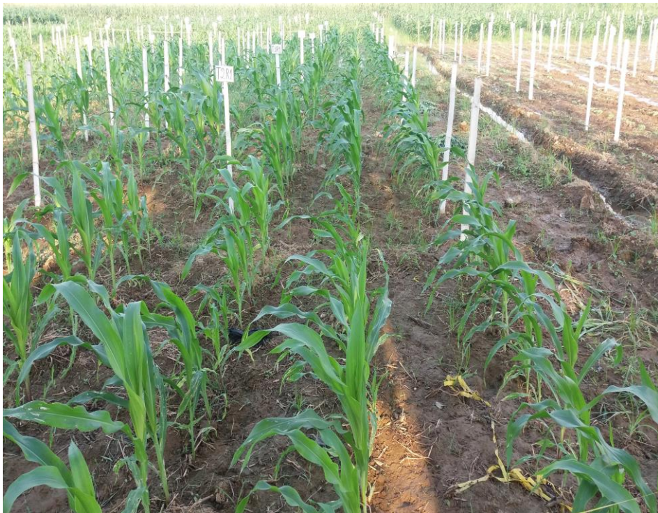
Figura 2. Aplicación de riego por gravedad al cultivo.