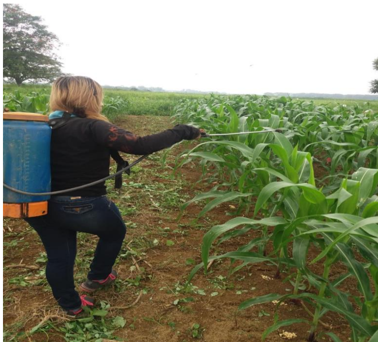
Figura 4. Control de Plagas.