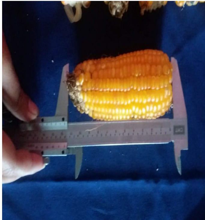
Figura 11. Evaluación de longitud de mazorca.