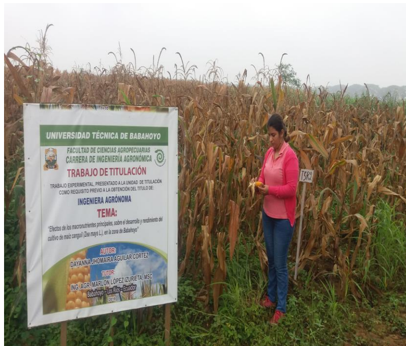
Figura 14. Cosecha