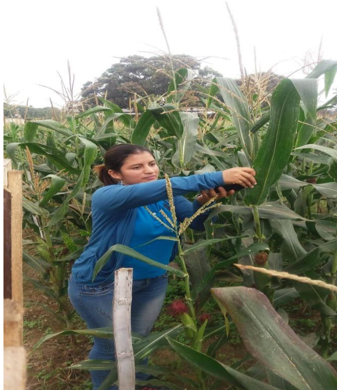
Figura 9. Evaluación de Clorofila.