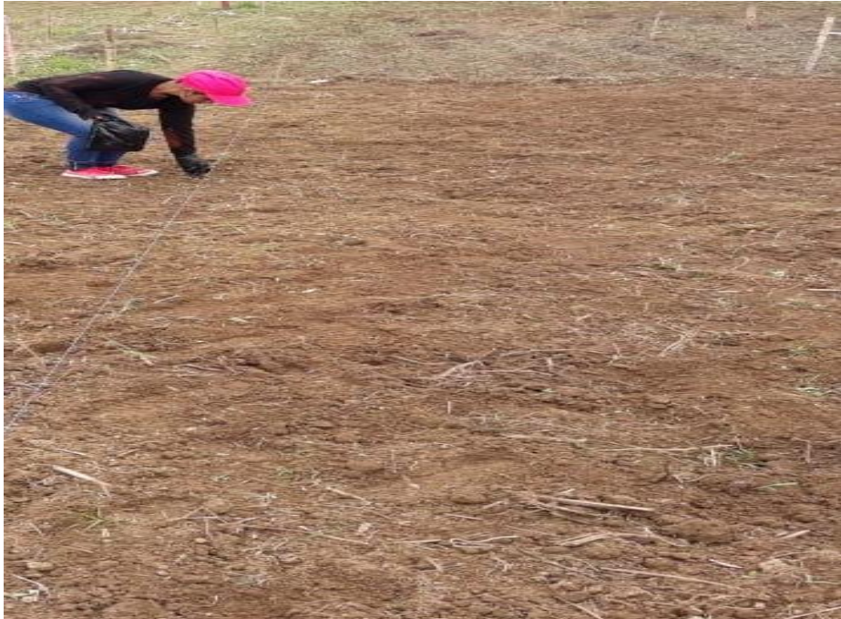
Figura 1. Siembra.