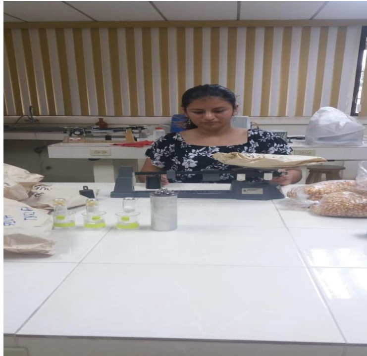
Figura 13. Peso de Materia Seca