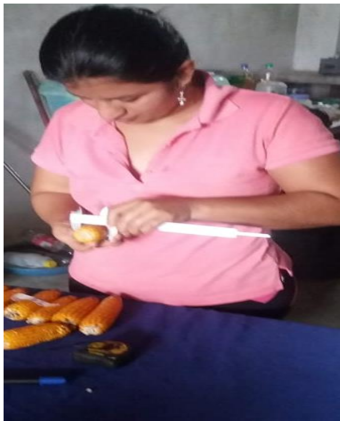
Figura 10. Evaluación de diámetro de mazorca.