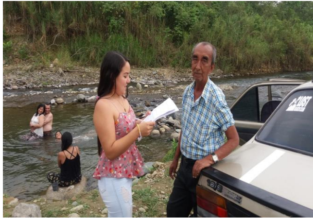
Encuesta a un turista en el río Cristal Autor: Paola Pazmiño