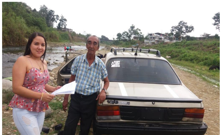
Encuesta a un turista en el río Cristal Autor: Paola Pazmiño