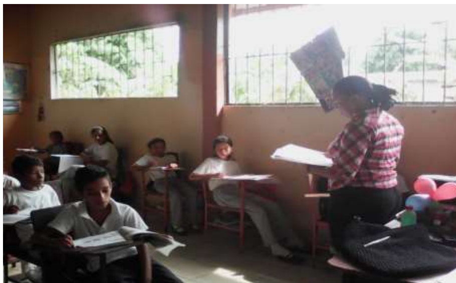
Realizando actividades con los estudiantes de la Escuela de Educación Básica “5 DE JUNIO ”