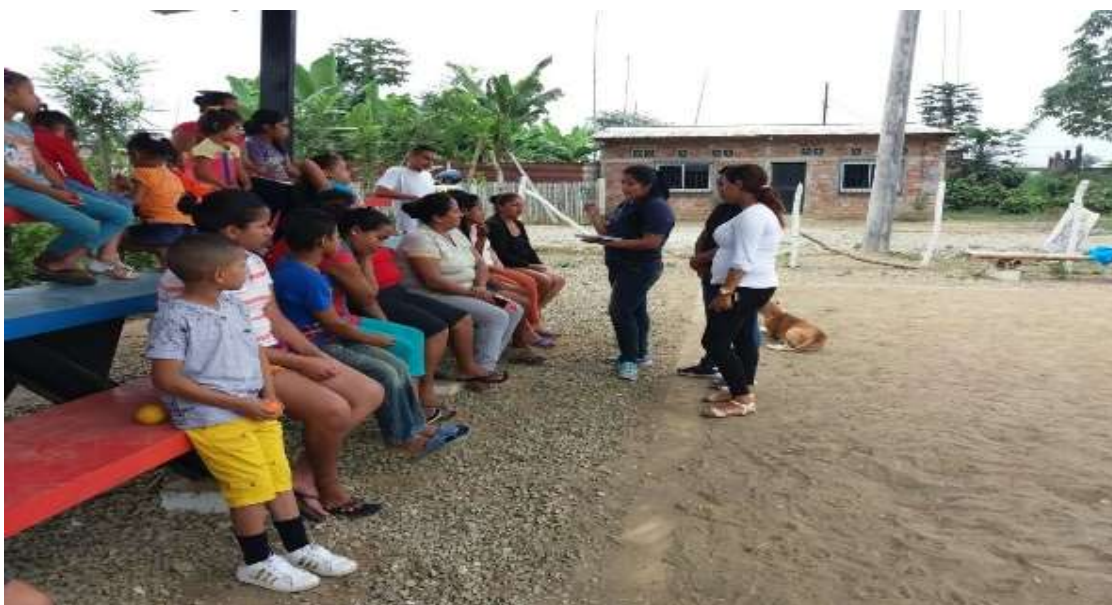
Encuesta con los padres de familia sobre los programas televisivos