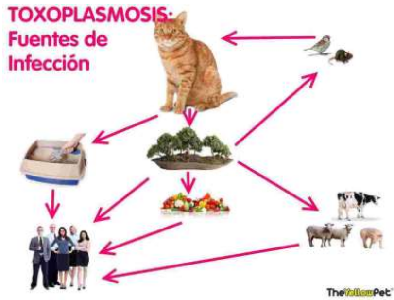
Figura 1. Fuentes de infección de la toxoplasmosis.