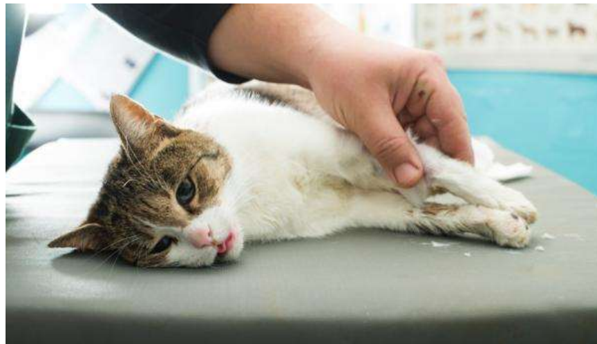
Figura 2. Felino con síntomas de toxoplasmosis.