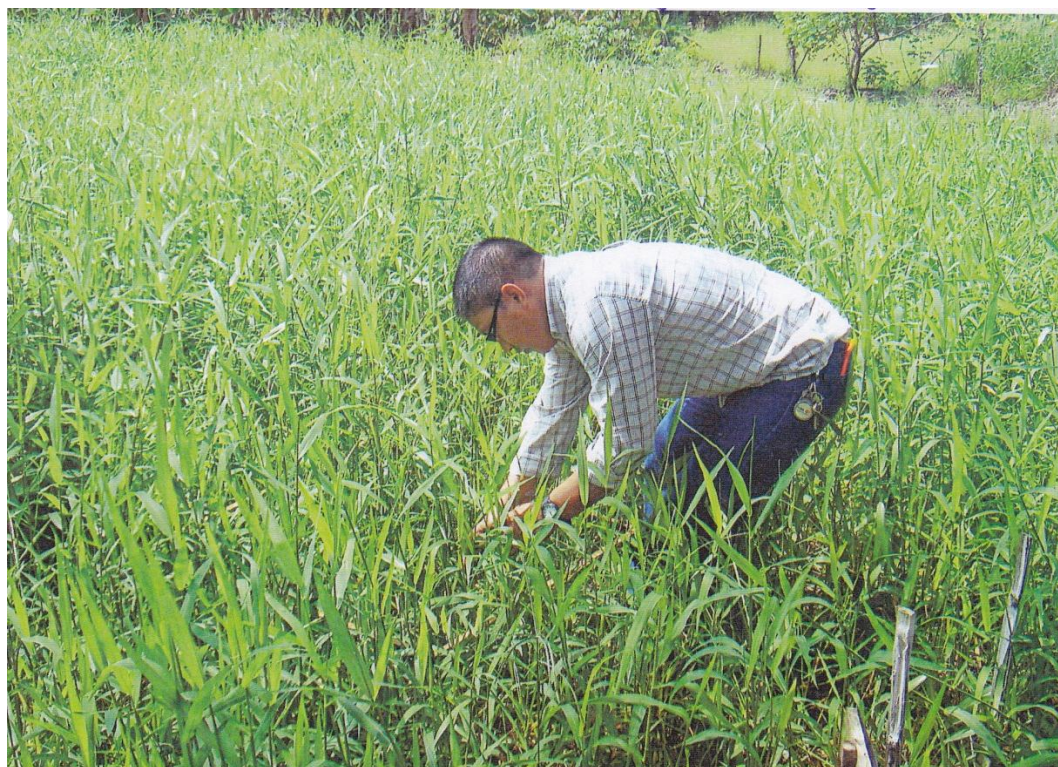
Figura 7. número de macollos por m 2