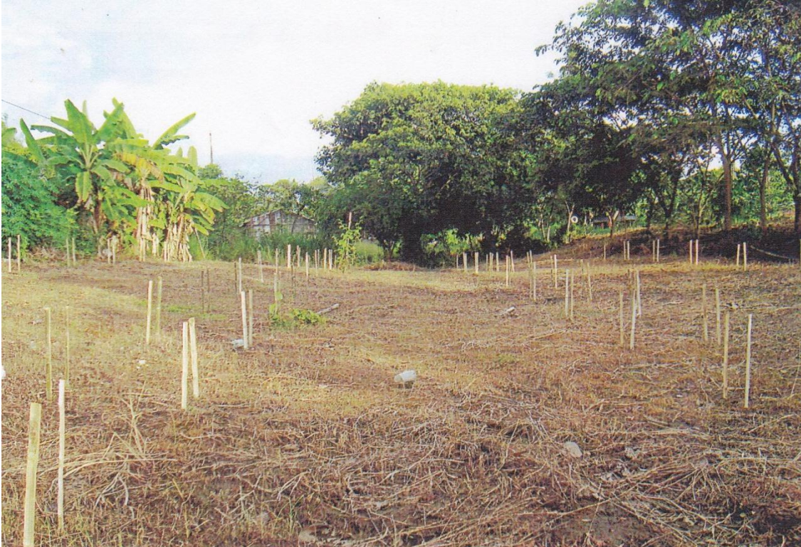
Figura 1. Área a sembrar