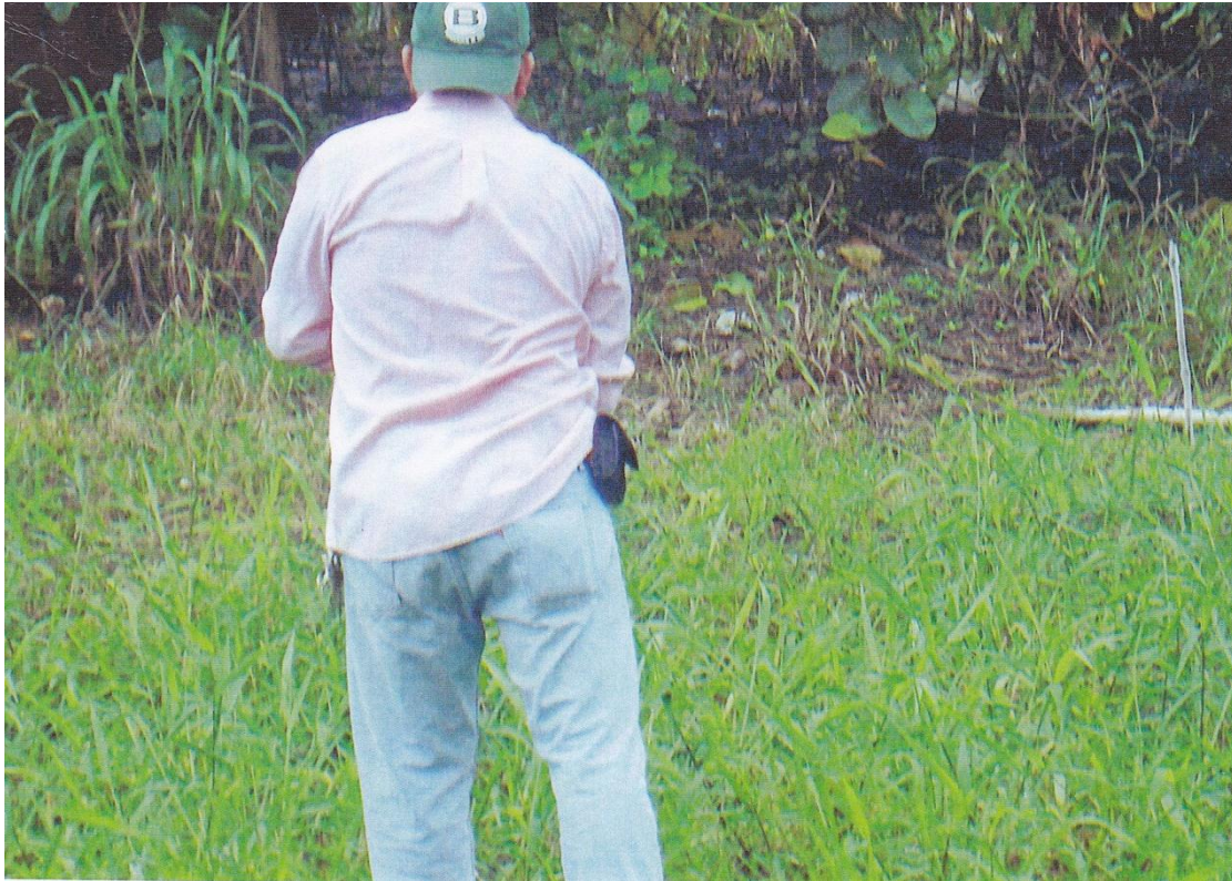
Figura 5. primera fertilización