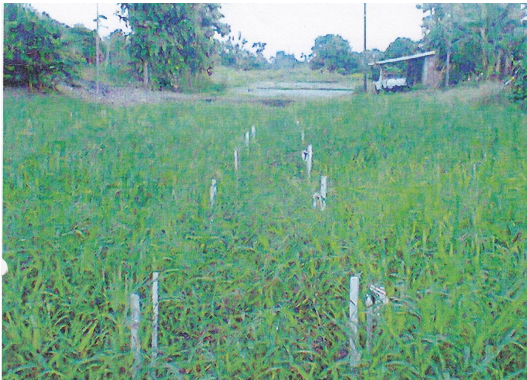
Figura 10. altura de planta 30-60-90 días