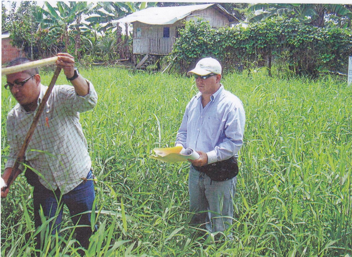
Figura 8. relación hoja-tallo