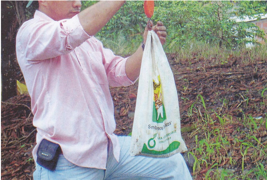
Figura 3. Dosis de fertilizantes aplicar por parcelas