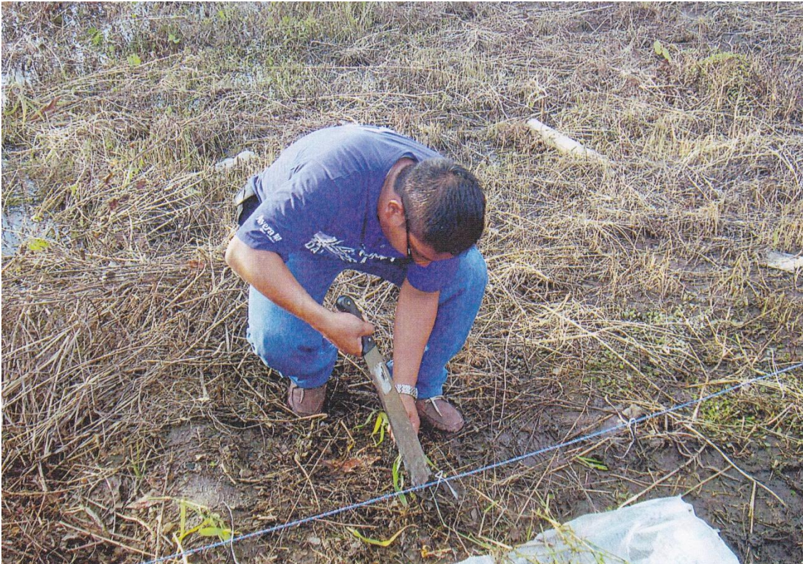
Figura 2. Siembra por material vegetativo