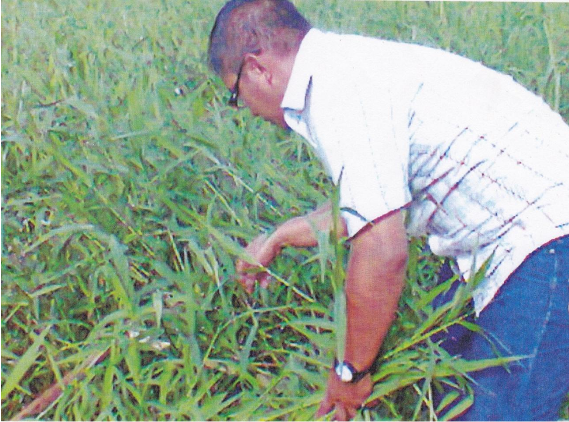
Figura 11. índice del área foliar