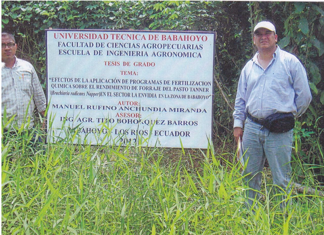
Figura 9. Ingresado y director de tesis