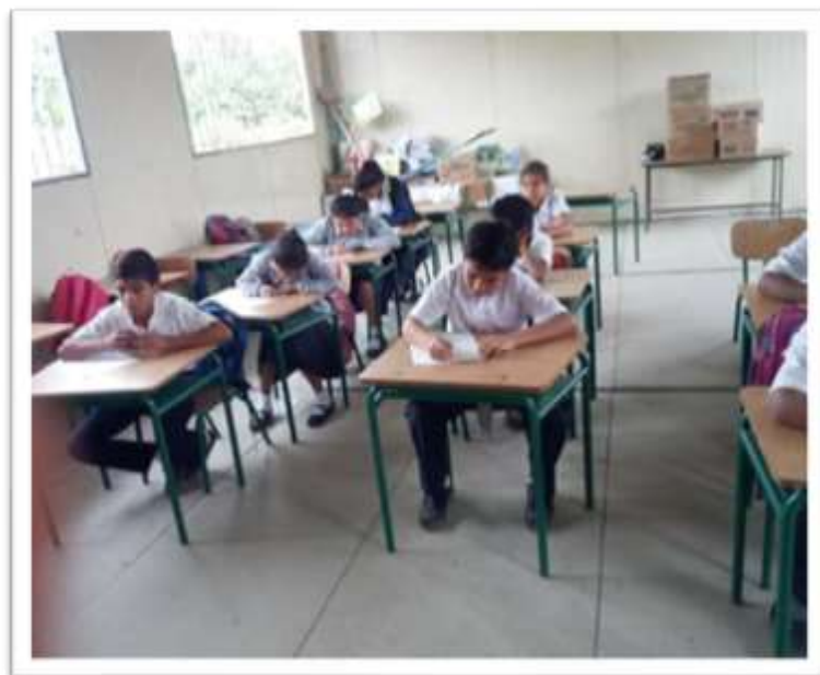
Charla con relación al Bullying