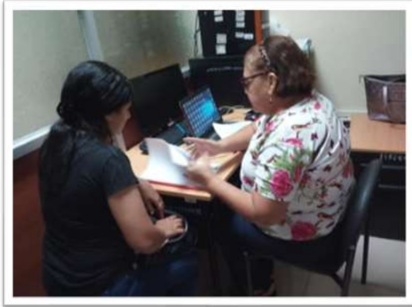
Guías del Tutor #1