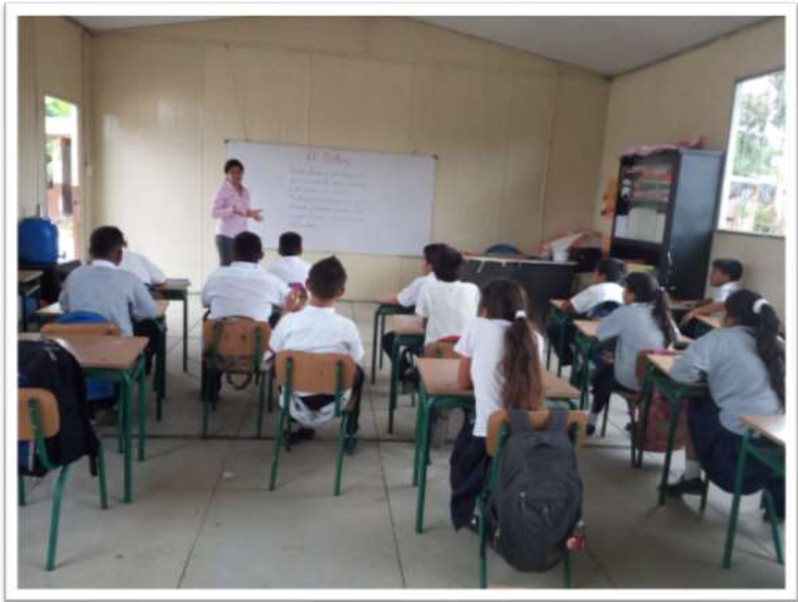
Charla con relación al Bullying