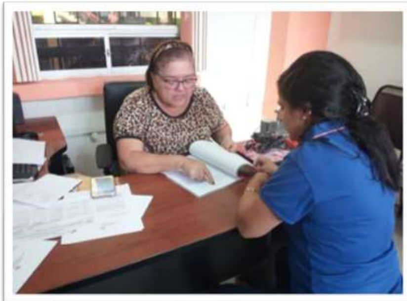
Guías del Tutor #2