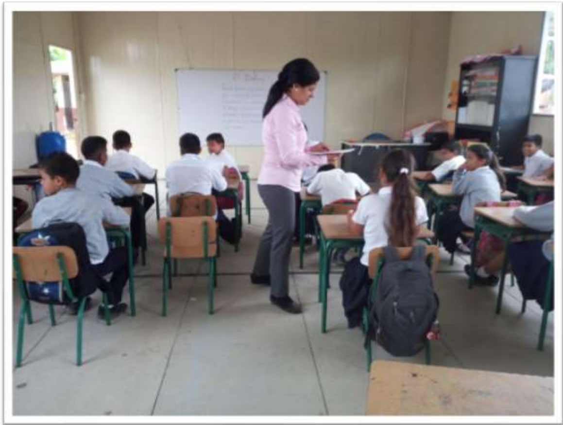
Charla con relación al Bullying