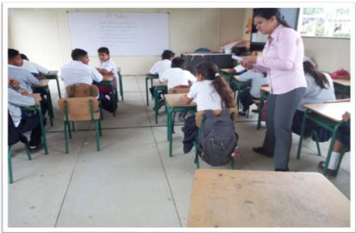
Charla con relación al Bullying