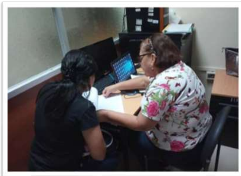
Guías del Tutor #3