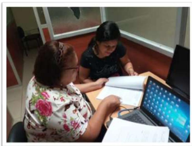
Guías del Tutor #4