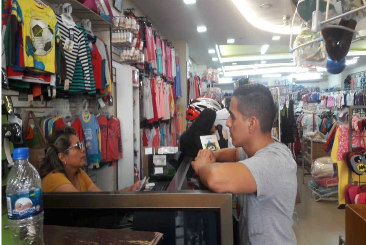
Realizando el check list