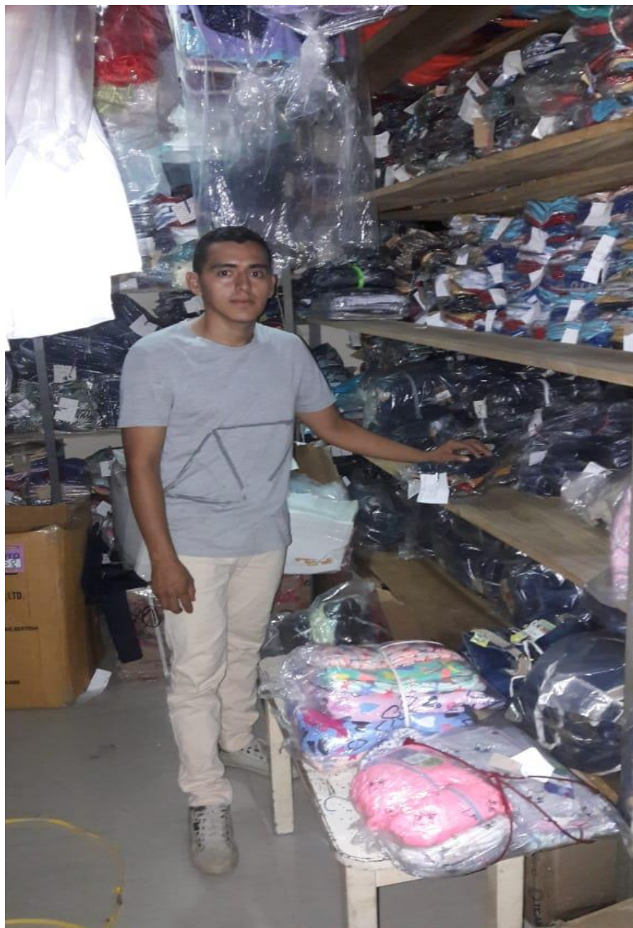
Realizando la observación de la bodega del almacén Skegui