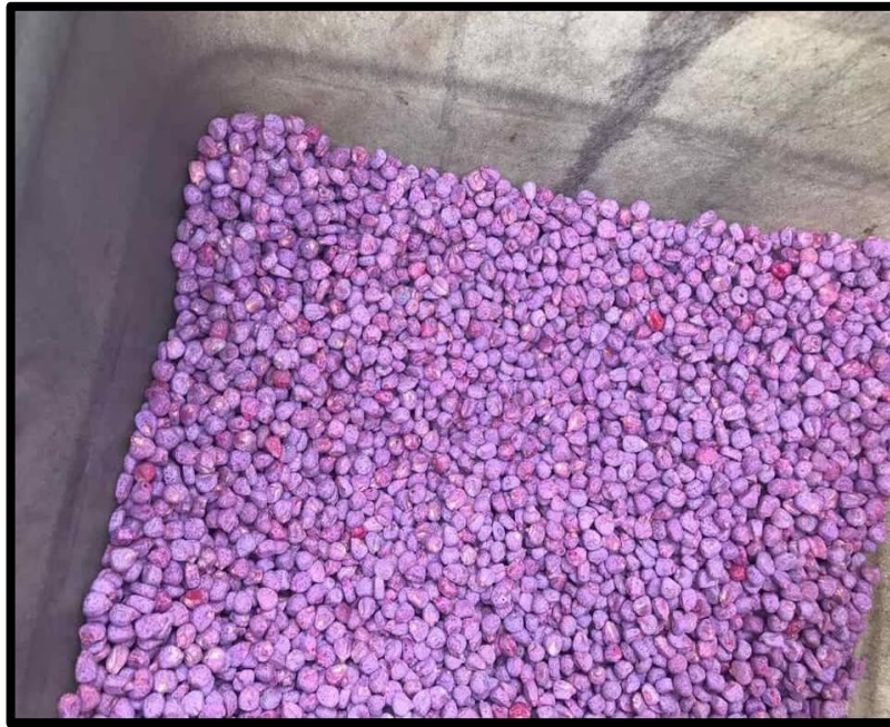
Fig. 1. Semilla de maíz