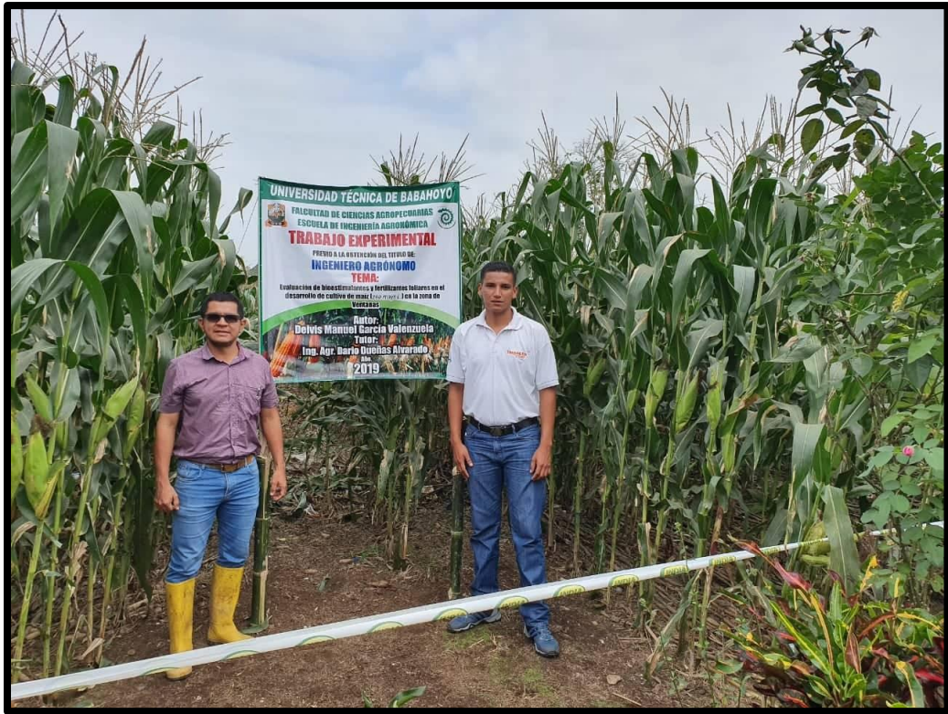
Fig. 5. Visita del coordinador de titulación