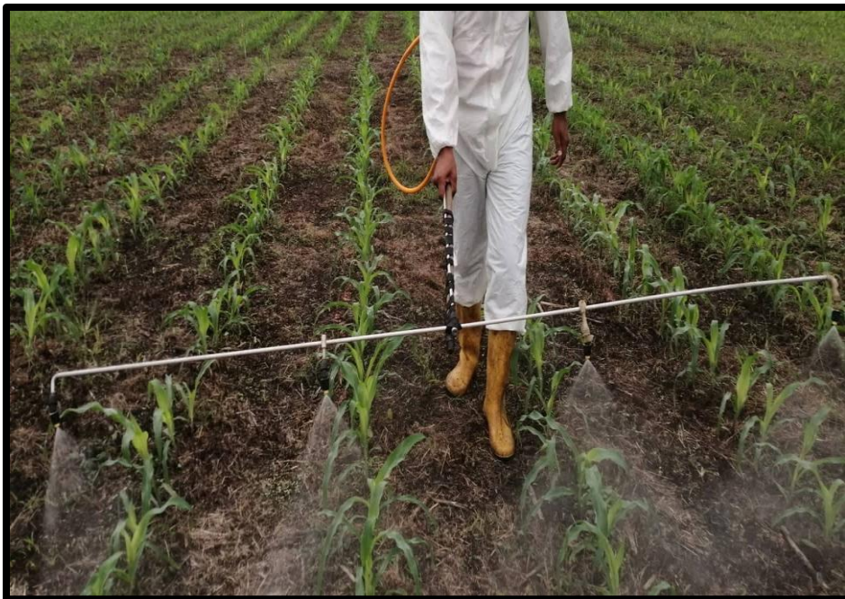
Fig. 2. Aplicación de los productos