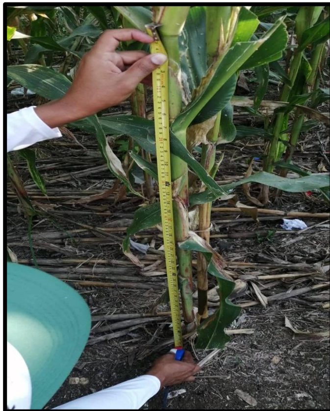
Fig. 4. Dato de altura de inserción de la mazorca