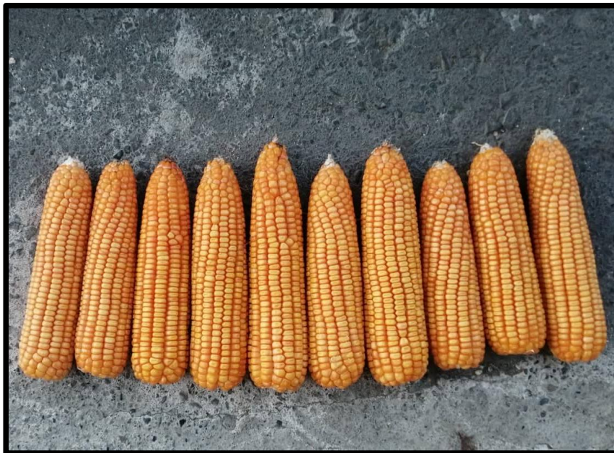
Fig. 8. Cosecha de mazorcas