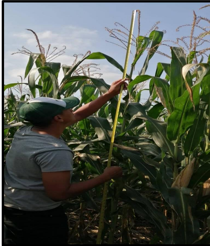
Fig. 3. Tomando altura de planta