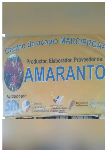
Foto 4.- Acopio, FACIAG, UTB, 2019