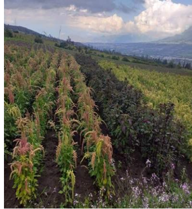
Foto 6.- Cultivo, FACIAG, UTB, 2019