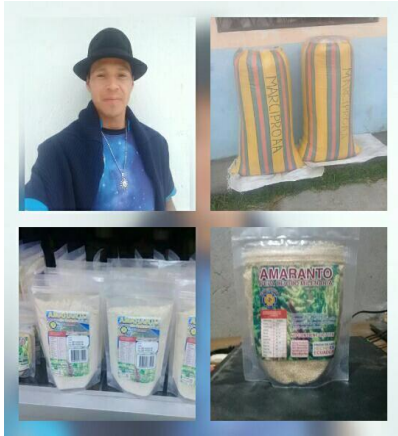
Foto 7.- Valor agregado, FACIAG, UTB, 2019