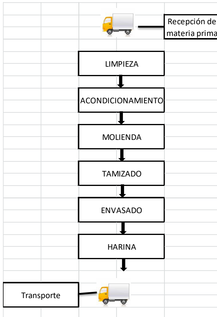
Diagrama 1.- Proceso de industrialización de harina, FACIAG, UTB, 2019.