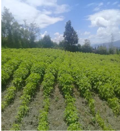
Foto 5.- Cultivo, FACIAG, UTB, 2019