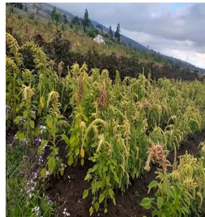
Foto 8.- Cultivo, FACIAG, UTB, 2019