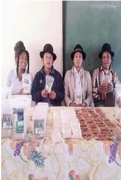
Foto 1.- Feria, FACIAG, UTB, 2019