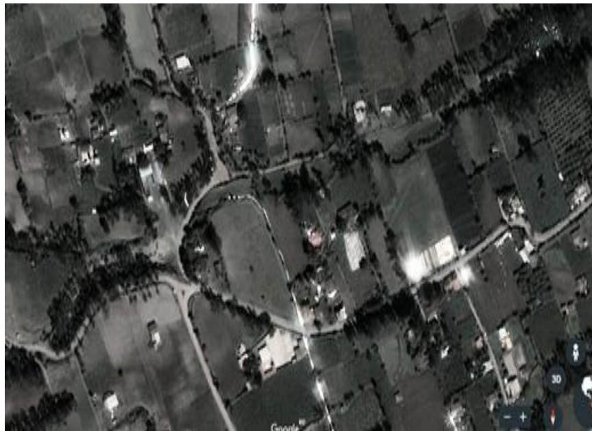
Mapa 1.- Comunidad de Iltaqi

La Comunidad de Iltaqi se ubicado en la parroquia el Sagrario, Cantón Cotacachi, Provincia de Imbabura.