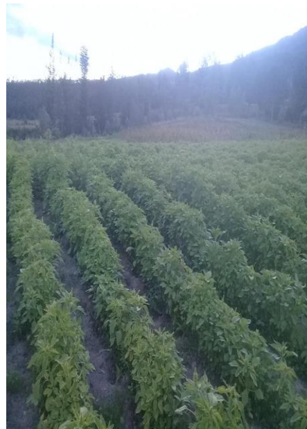
Foto 2.- Cultivo, FACIAG, UTB, 2019