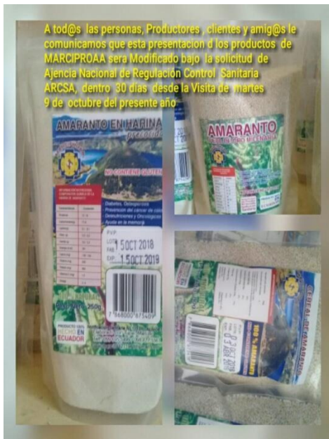
Foto 3.- Valor agregado, FACIAG, UTB, 2019