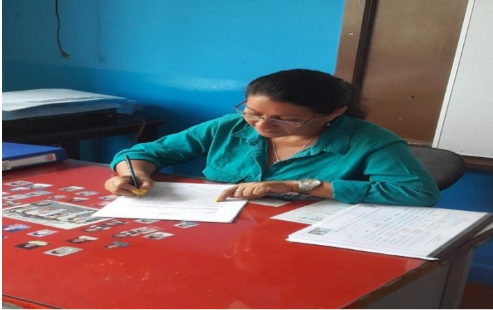
Realización del test EDAH por parte de la profesora de la niña.