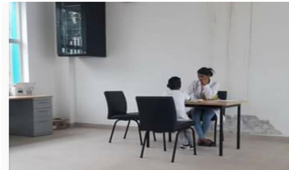
Aplicación De Test Psicológicos