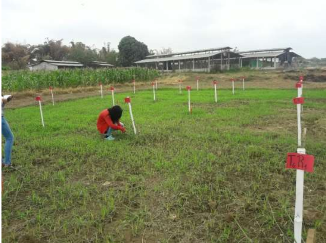
Toma de datos en campo: Longitud de planta