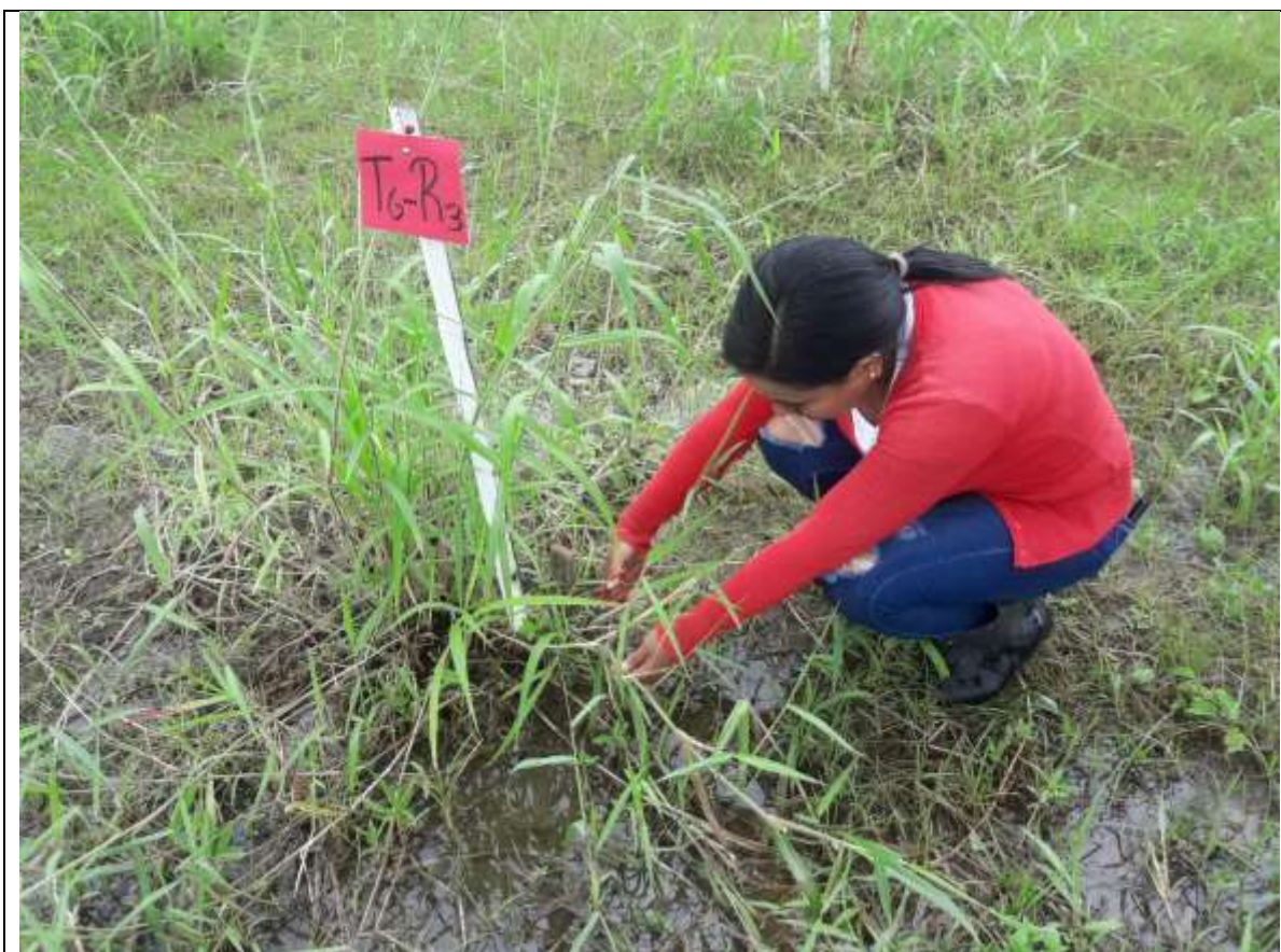
Toma de datos en campo: Numero de hojas por planta