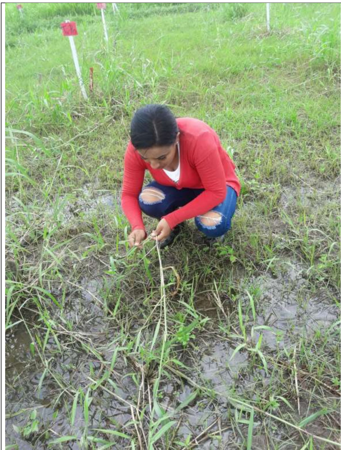
Toma de datos en campo: Área foliar