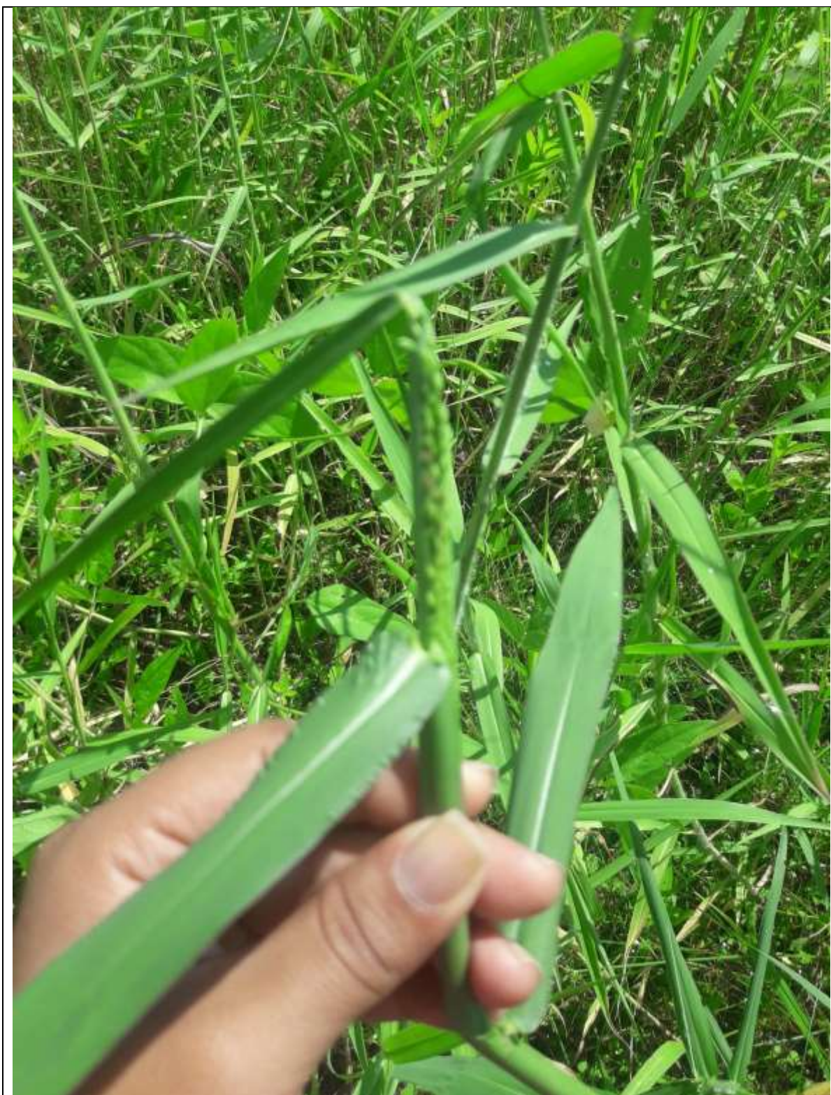
Toma de datos en campo: Días de floración