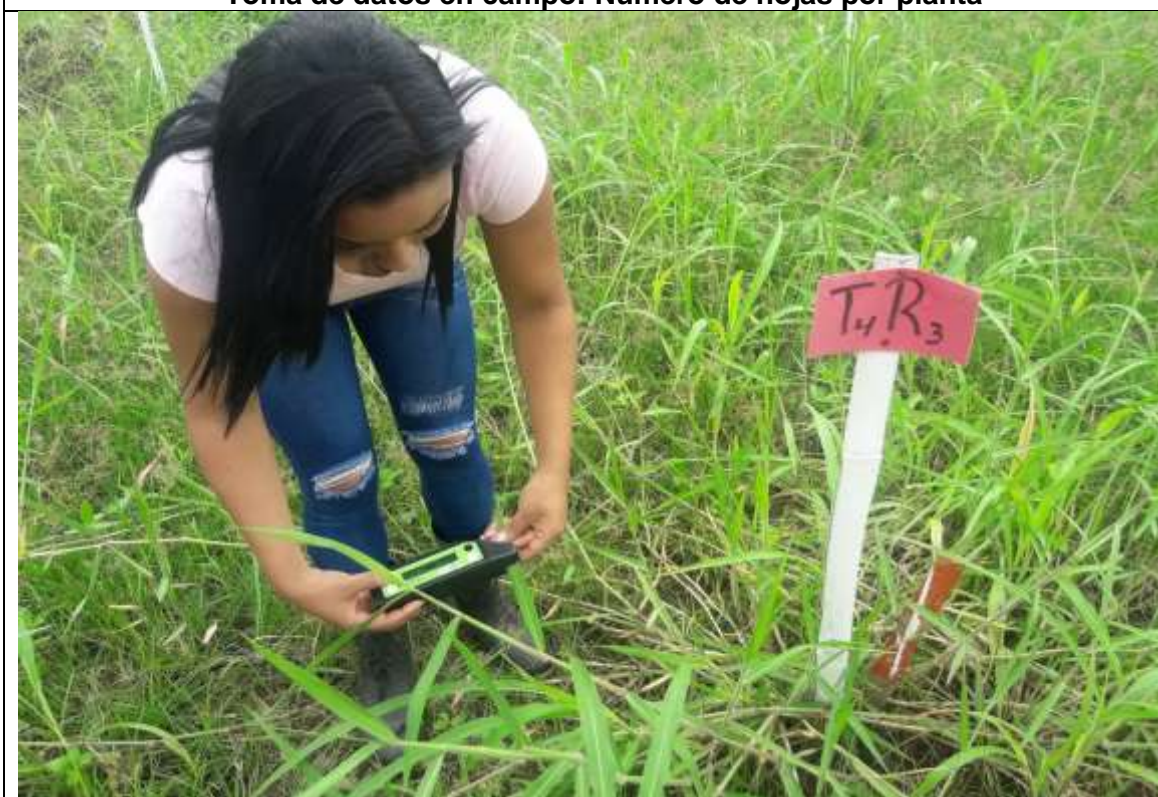
Toma de datos en campo: Nivel de clorofila