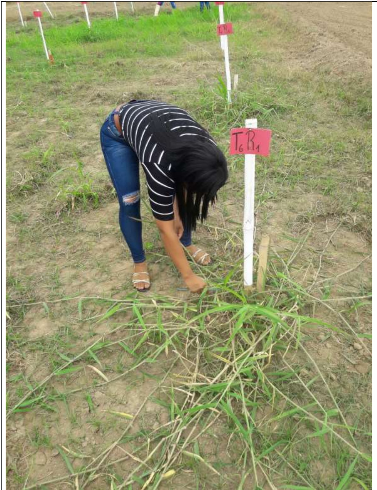
Toma de datos en campo: Numero de nudos por planta