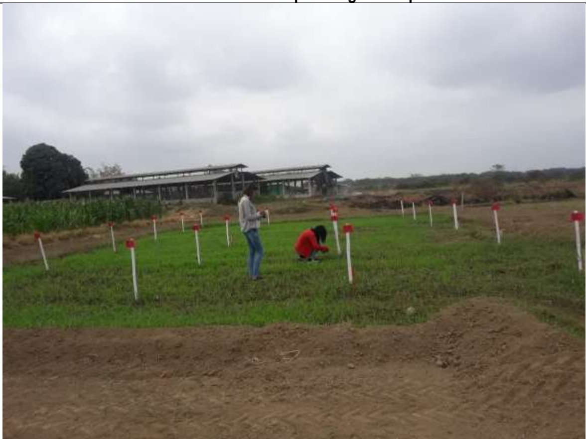
Toma de datos en campo: Diámetro de tallo