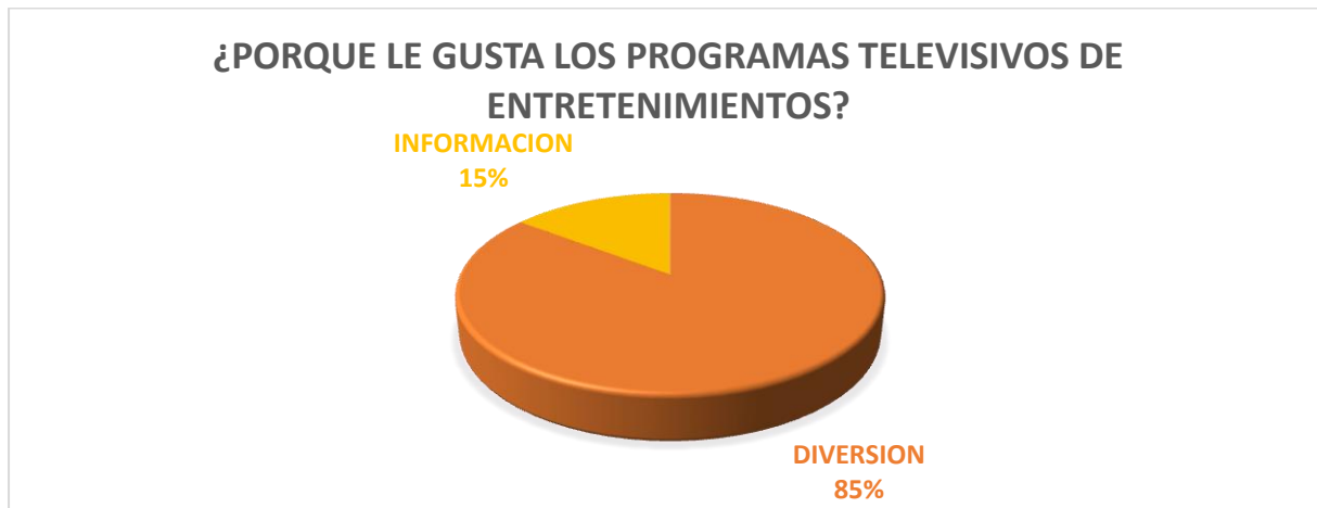
GRAFICO 6. PREGUNTA 6