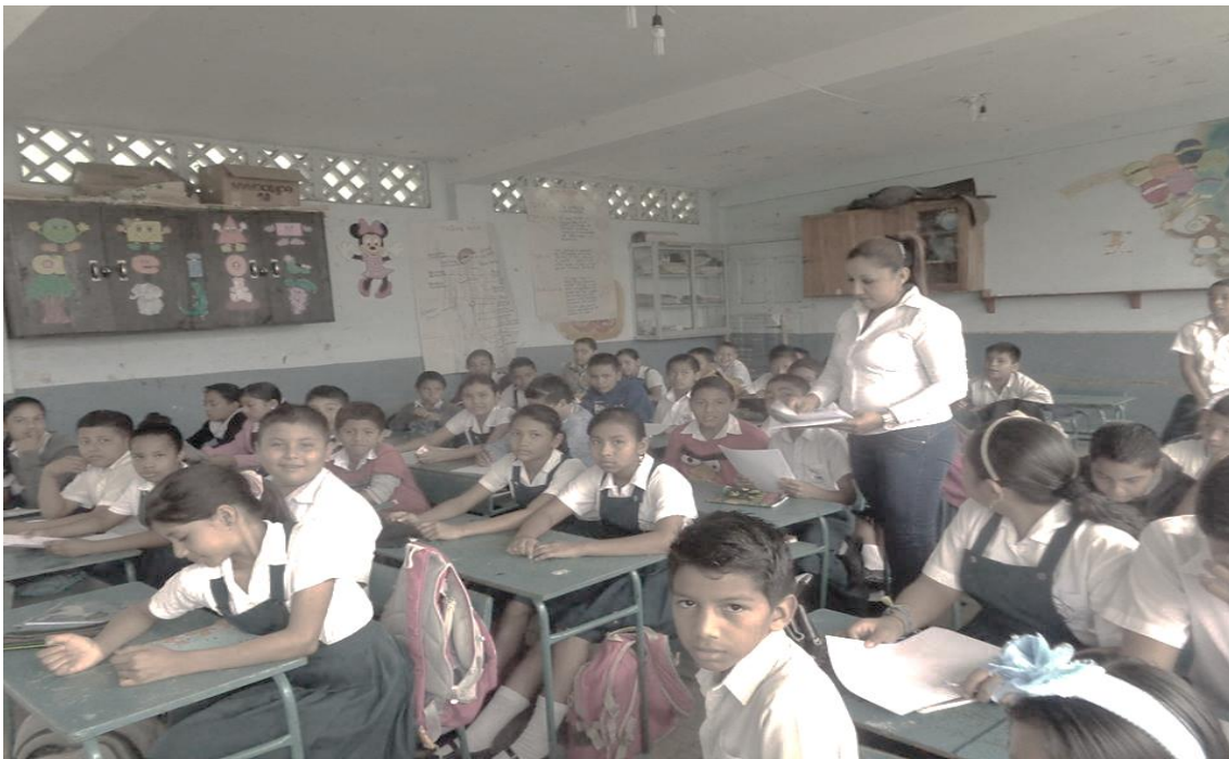
ENTREGANDOLES A LOS NIÑOS LA ENCUESTA