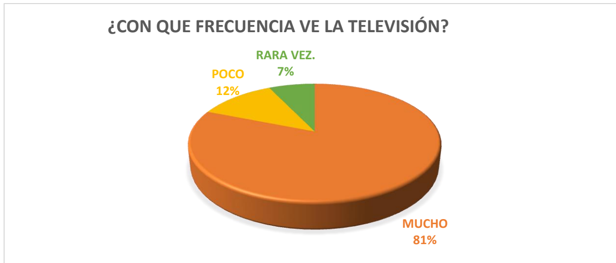
GRAFICO 2. PREGUNTA 2