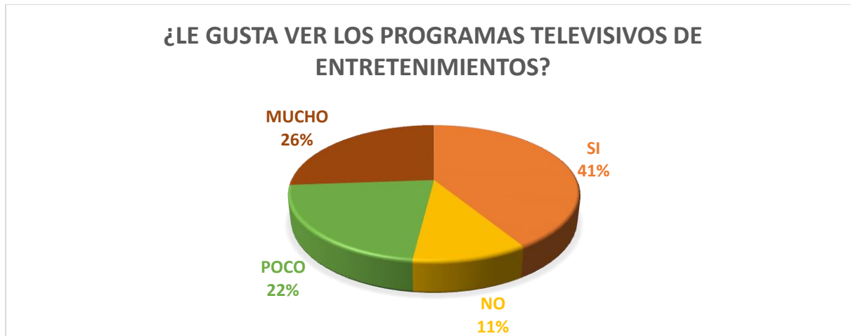
GRAFICO 4. PREGUNTA 4