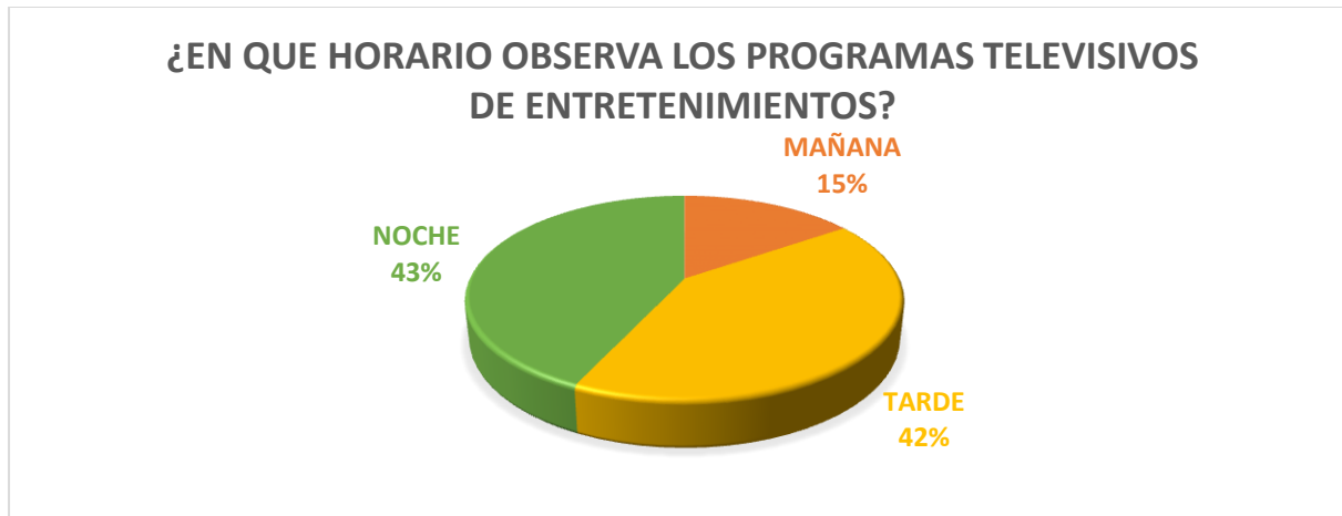
GRAFICO 7. PREGUNTA 7