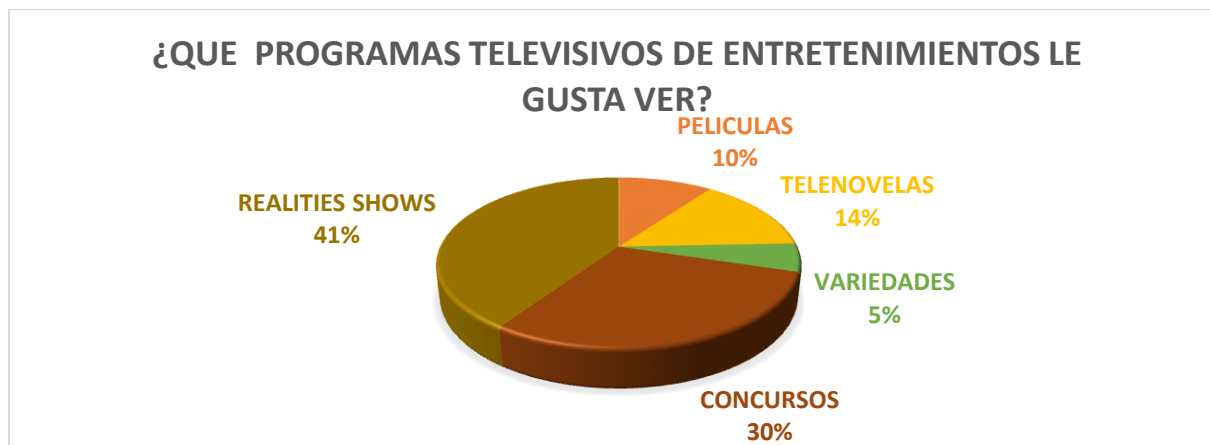
GRAFICO 5. PREGUNTA 5