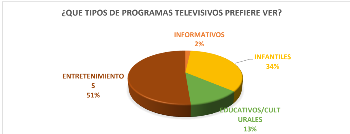
GRAFICO 3. PREGUNTA 3