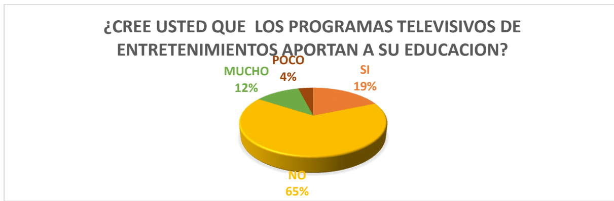
GRAFICO 8. PREGUNTA 8