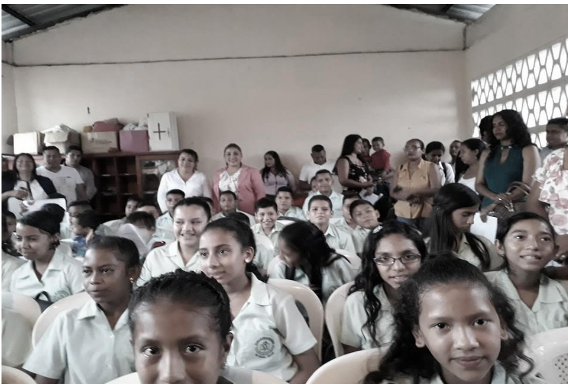
SOCIALIZANDO EL TEMA DE INVESTIGACION CON LOS ESTUDIANTES Y PADRES DE FAMILIA.