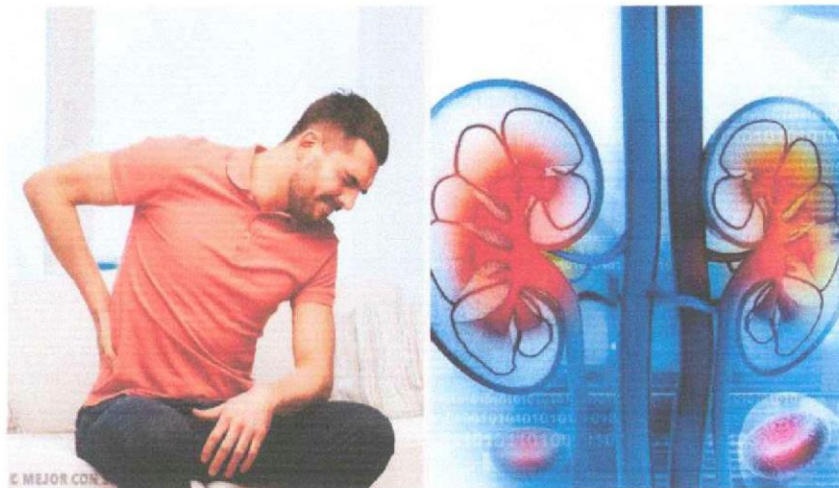
Fig.2 Signo de la Insuficiencia Renal Aguda