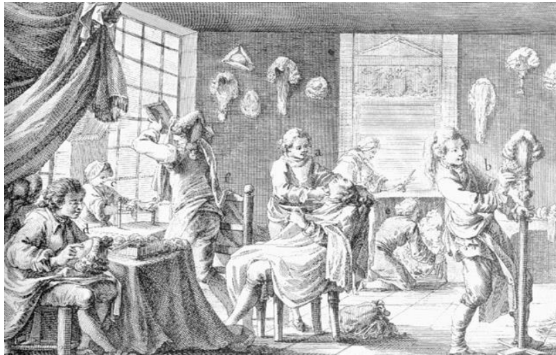
Figura # 5: Barbería/tienda de pelucas de Francia en el Siglo XVIII.