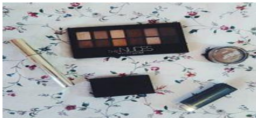
Figura # 6: Maquillaje en cine y televisión.