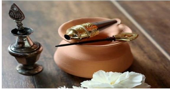
Figura # 3: Elaboración del maquillaje en la antigüedad.