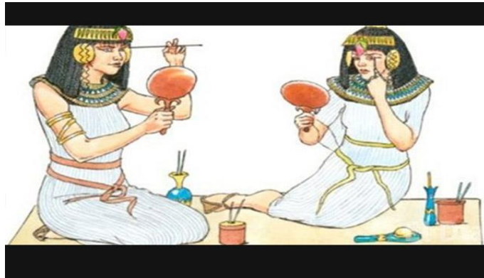
Figura # 4: Utilización del maquillaje en la antigüedad.