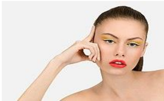
Figura # 1: Ejemplo de maquillaje en una modelo.