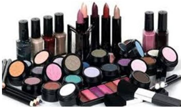
Figura # 8: Tipos de maquillaje.