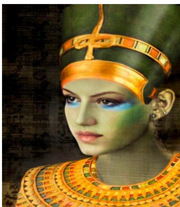
Figura # 2: Historia del maquillaje.