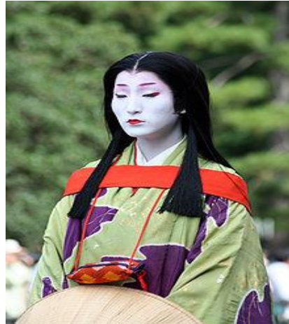
Figura # 7: Maquillaje de geisha.