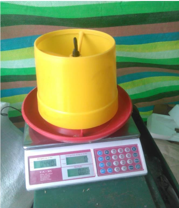
Pesaje de cada comedero