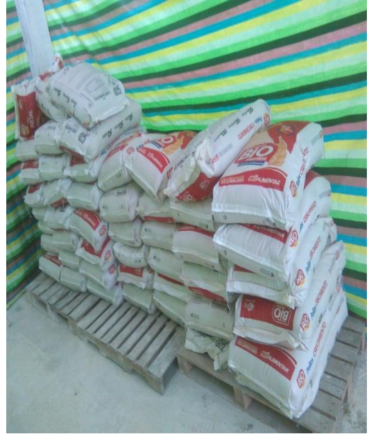
Resección del Alimento