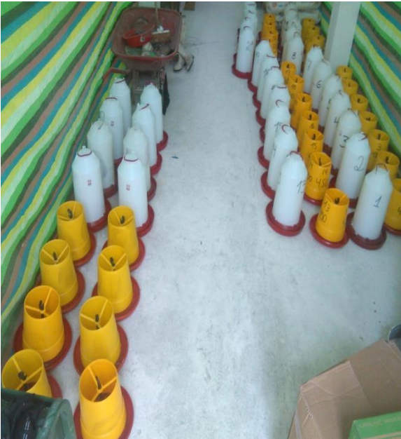
Comederos y Bebederos