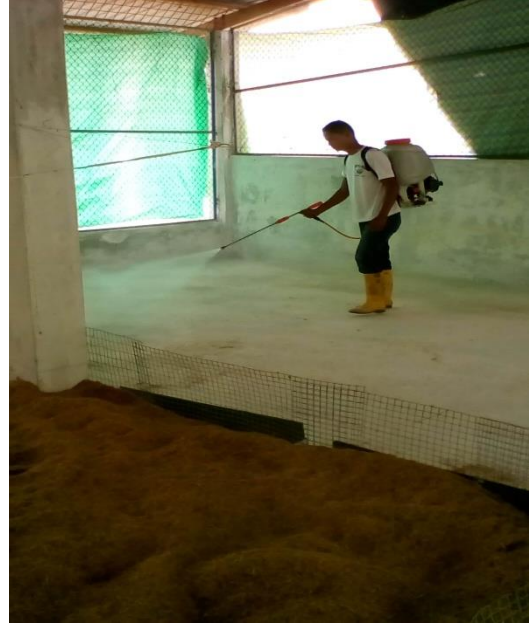
Desinfección del galpón