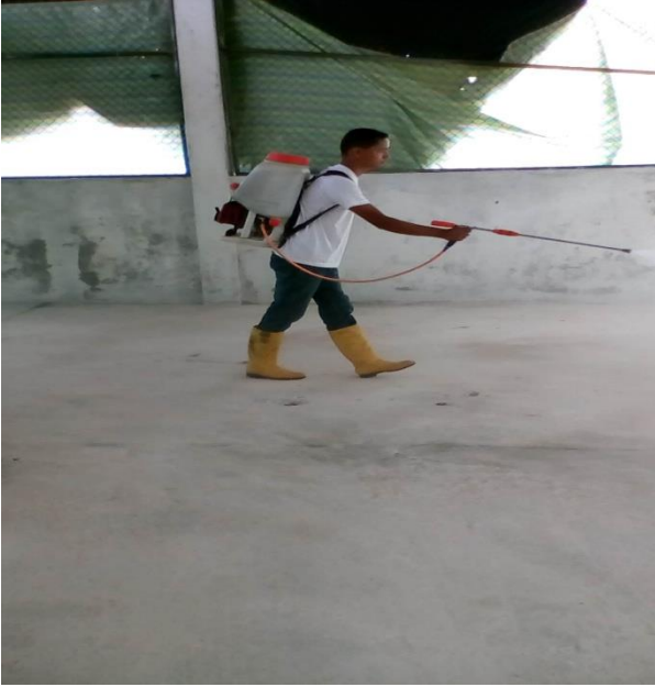
Desinfección del galpón