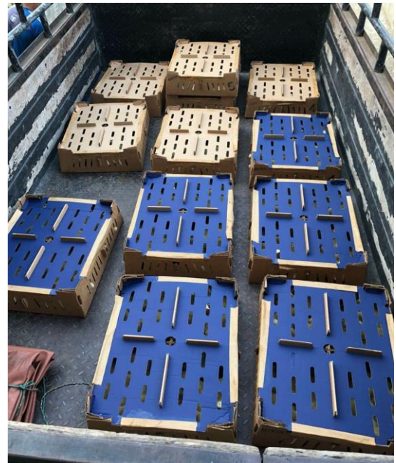
Resección de los pollitos