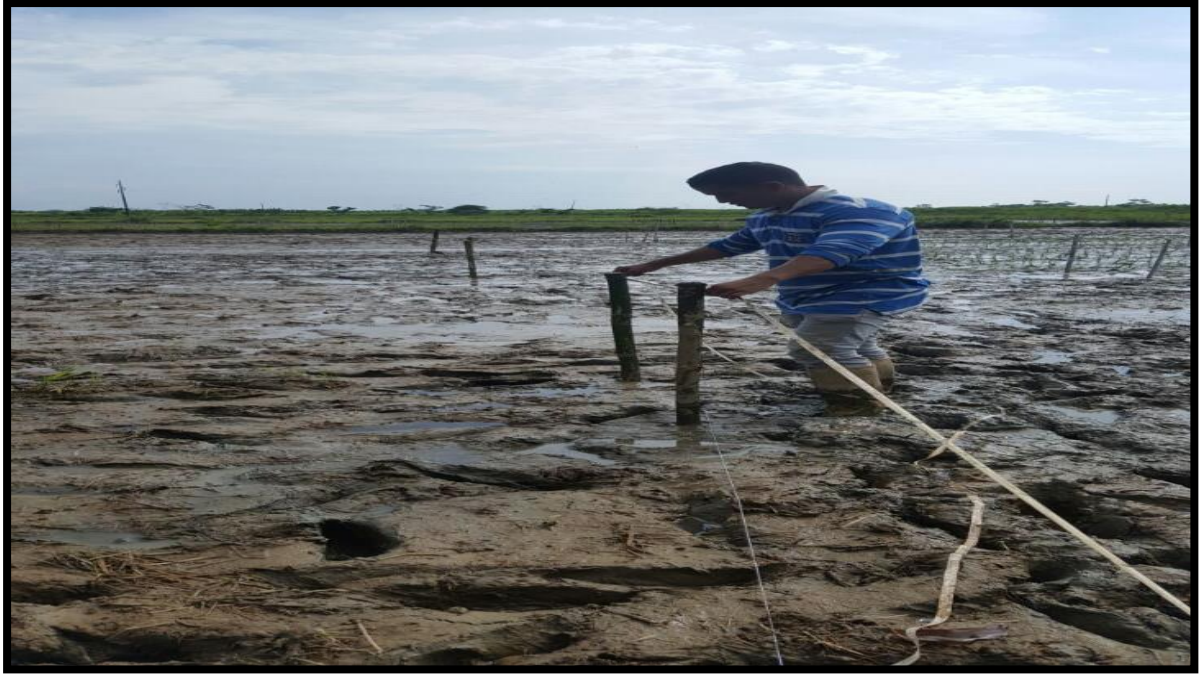
Fig. 3. Medición de parcelas, siembra.