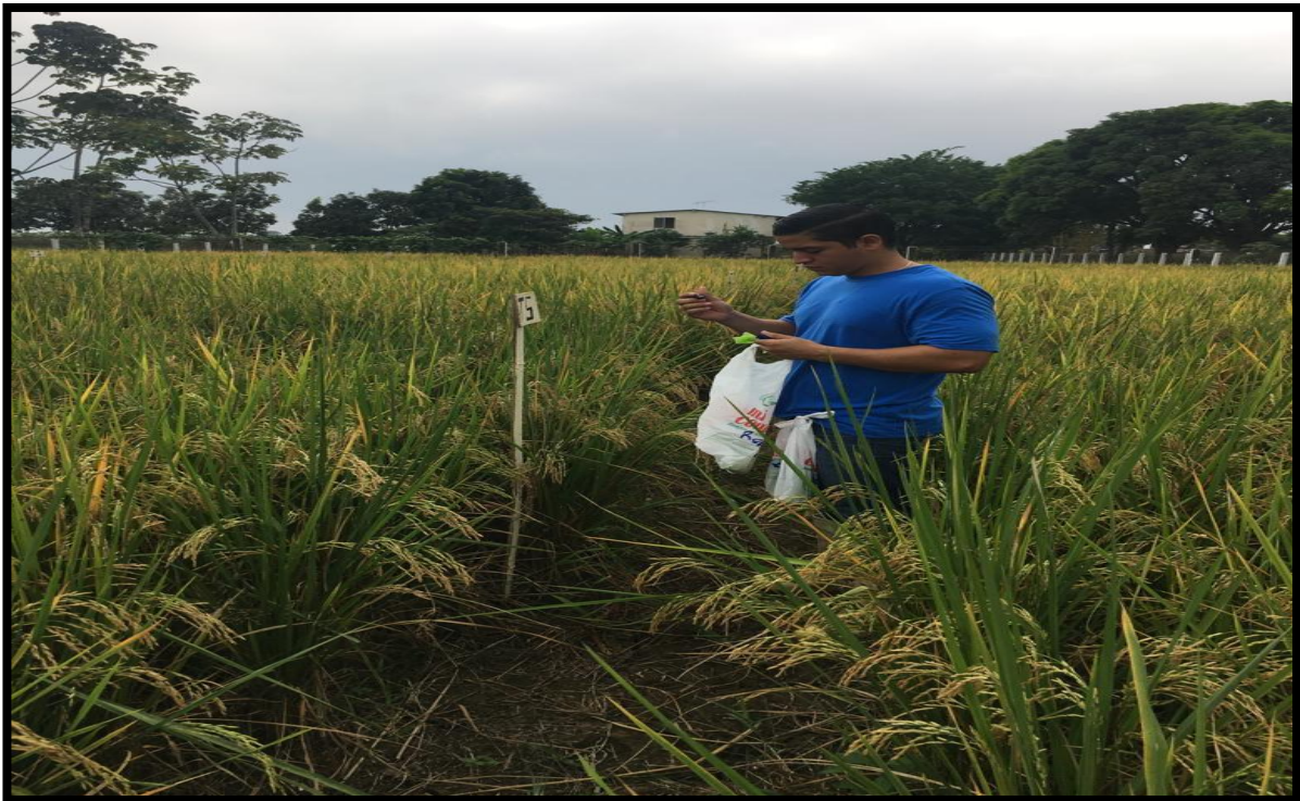
Fig. 10. Muestras para la identificación del hongo o bacteria