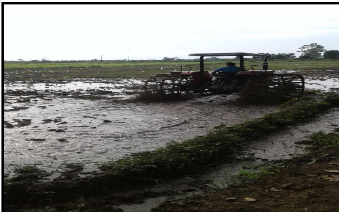
Fig. 2. Preparación del suelo