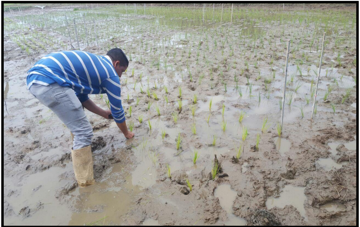
Fig. 4. Siembra de las diferentes variedades