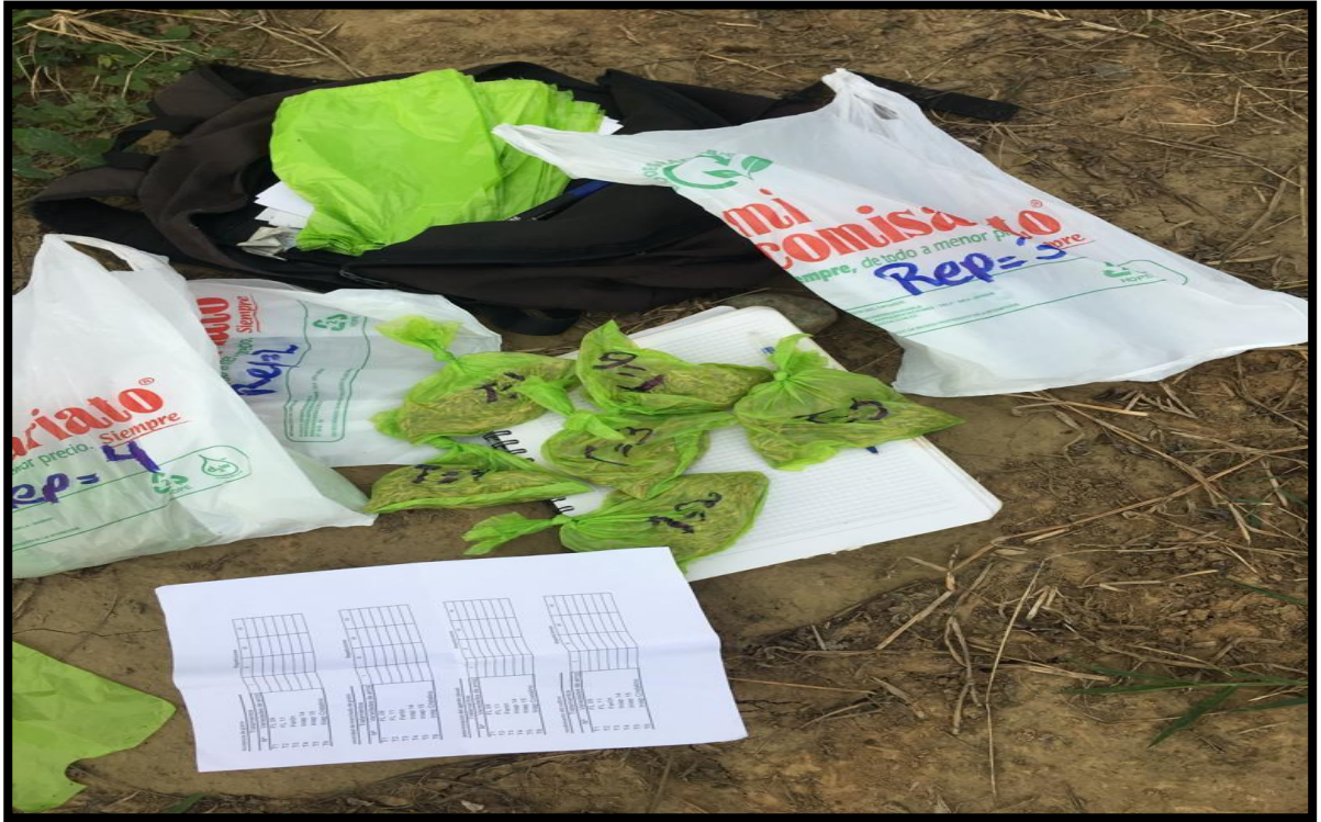
Fig. 11. Recolección de muestras