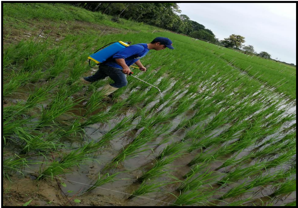
Fig. 5. Aplicación de fertilizante foliar