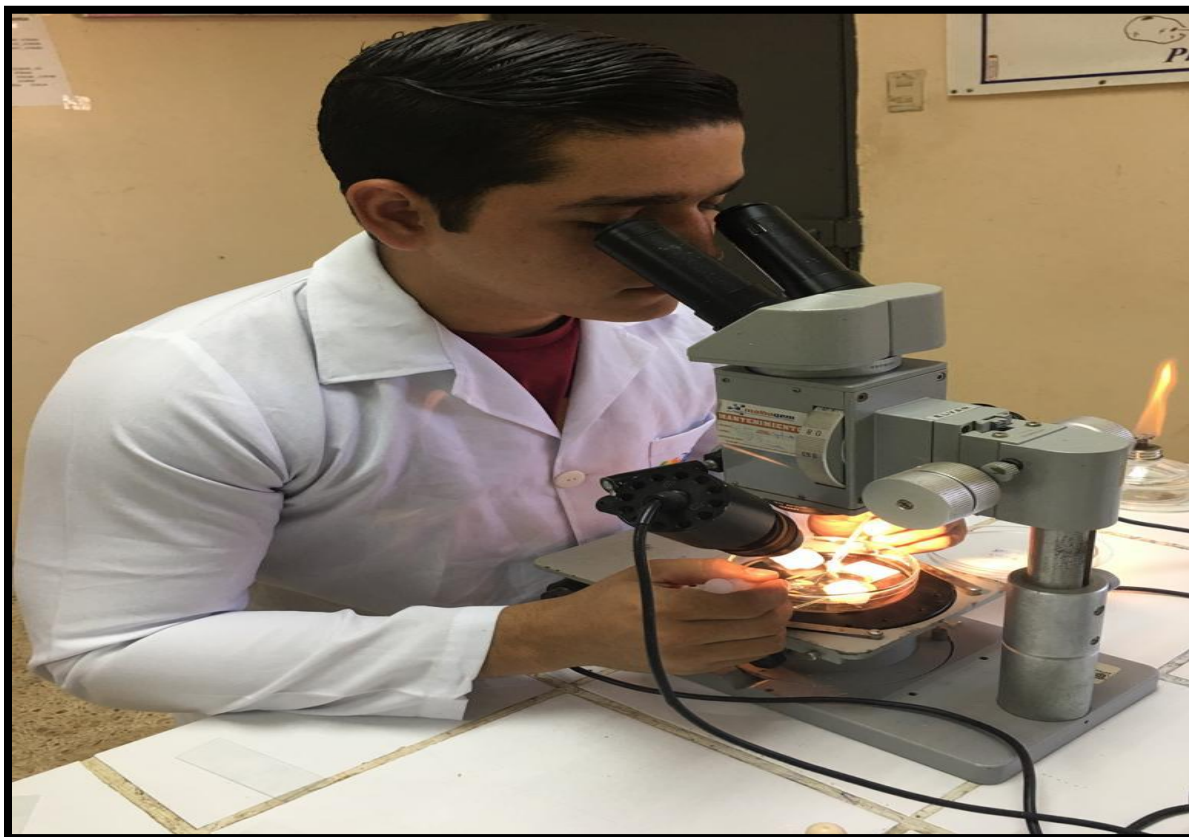
Fig. 17. Identificación de Helminthosporium y Curvularia