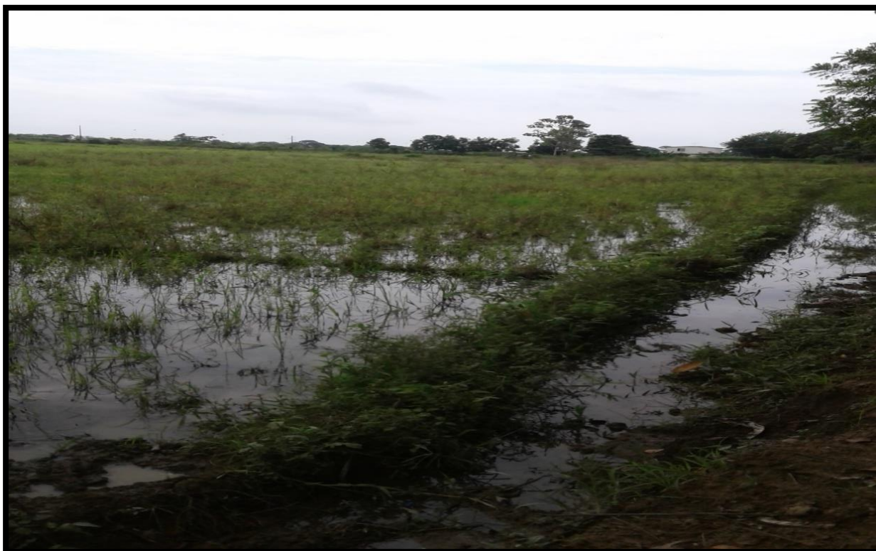
Fig. 1. Terreno de la Facultad de Ciencias Agropecuarias, CEDEGE