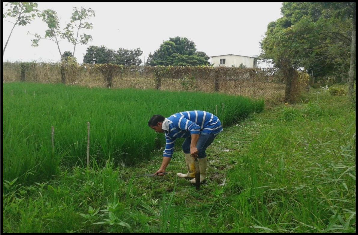
Fig. 7. Deshierbe manual de los alrededores