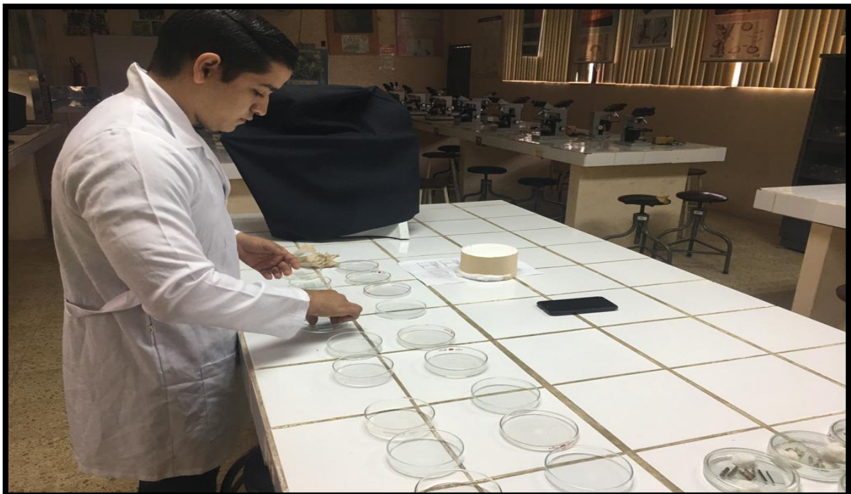
Fig. 12. Laboratorio. Cajas petri desinfectadas