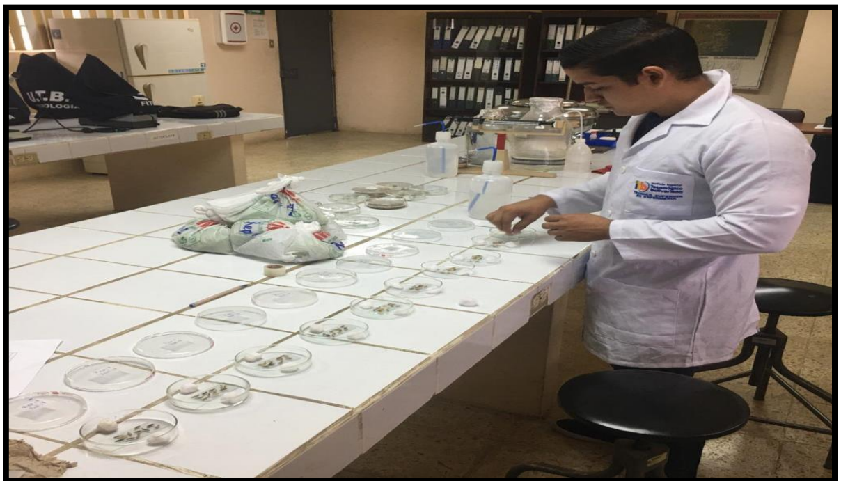
Fig. 14. Revisión del desarrollo del hongo o bacteria