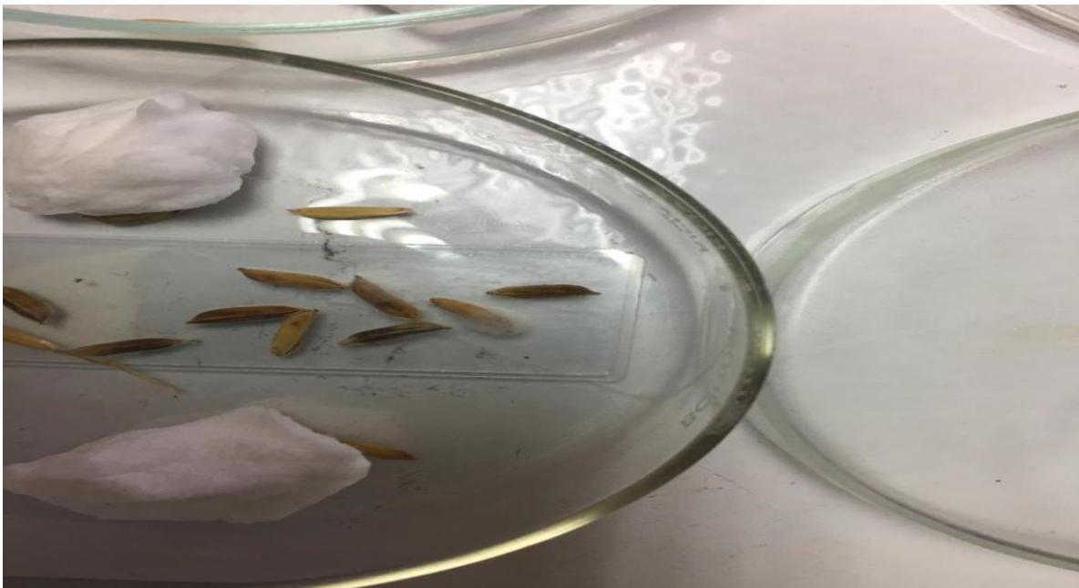
Fig. 16. Selección de muestra para la identificación