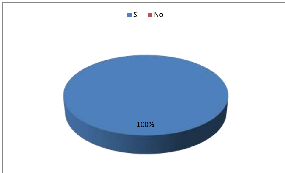
Gráfico 2: Estimulación en la lectura