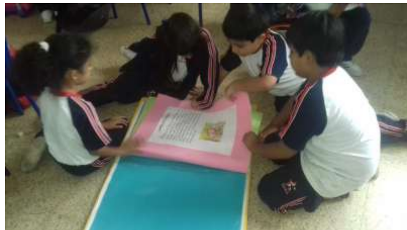
Niños revisando el texto.