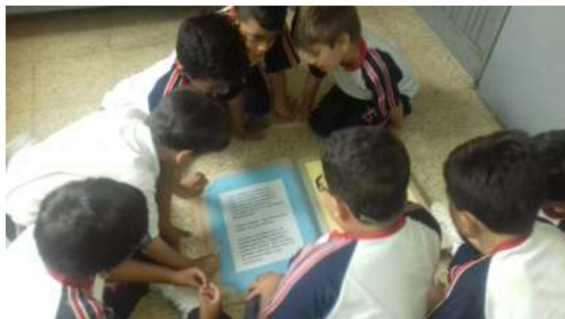
Los estudiantes participando en la lectura grupal.