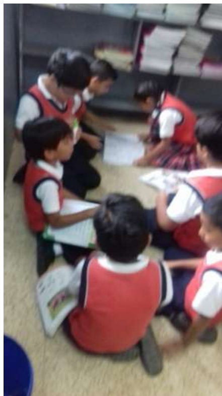
Los alumnos revisando el texto y reforzando la lectura