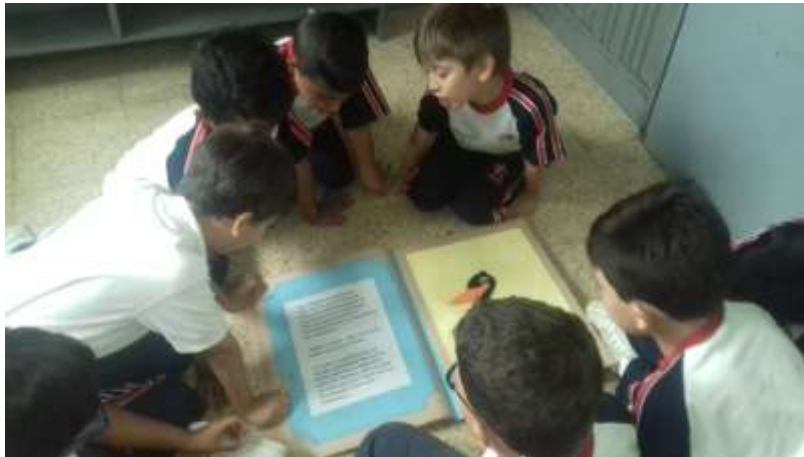
Los estudiantes formando parte del taller de lectura impartido.