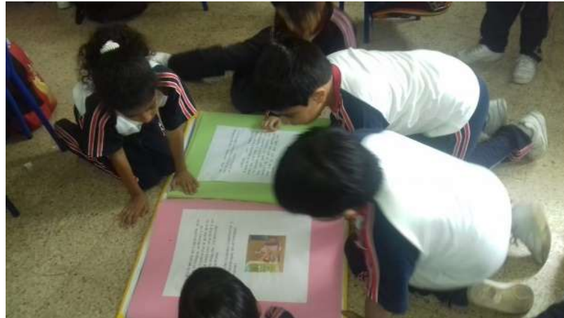
Niños practicando la lectura.