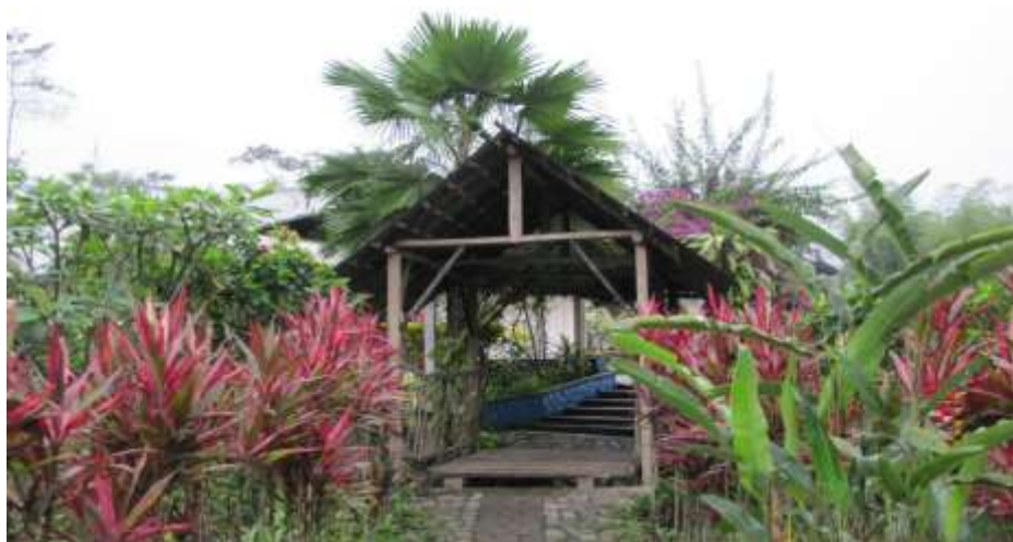
FIGURA 3._ SENDERO QUE DIRIGE AL RIO TIGRILLO FUENTE: COMPLEJO TURISTICO LA PERLA AUTORA: YADIRA MARILYN CUJILEMA CHAVEZ