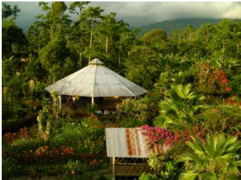
FIGURA 2._ PAISAJE NATURAL DEL COMPLEJO TURISTICO LA PERLA