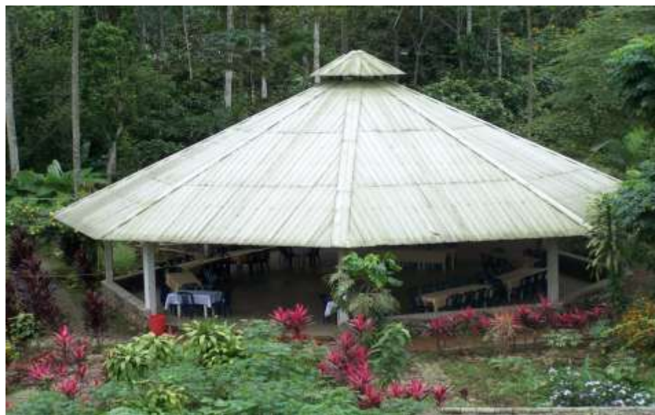
FIGURA 4._ CABAÑA DE ALIMENTACION FUENTE: COMPLEJO TURISTICO LA PERLA AUTORA: YADIRA MARILYN CUJILEMA CHAVEZ