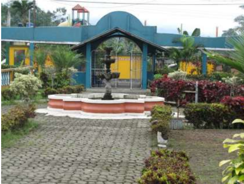
FIGURA 1._ ENTRADA AL COMPLEJO TURISTICO LA PERLA