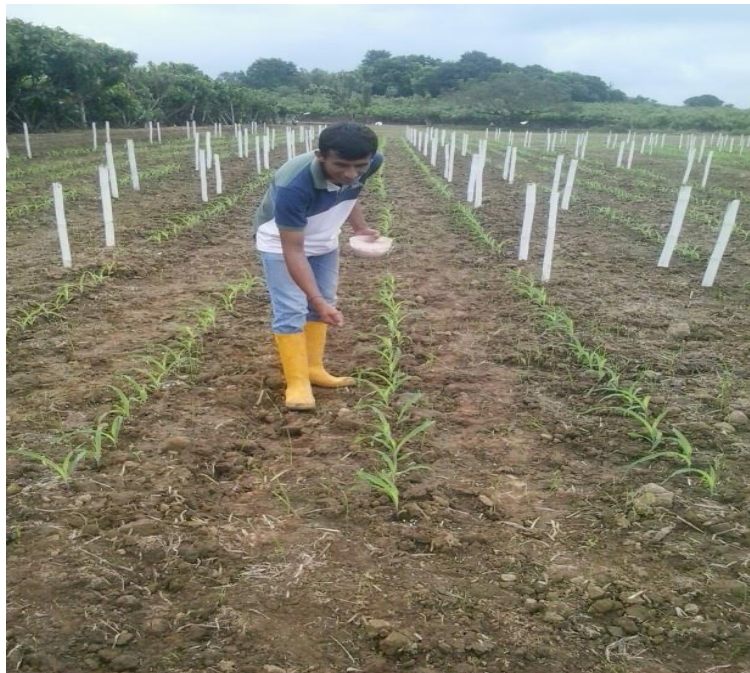
Figura 3. Fertilización del cultivo.