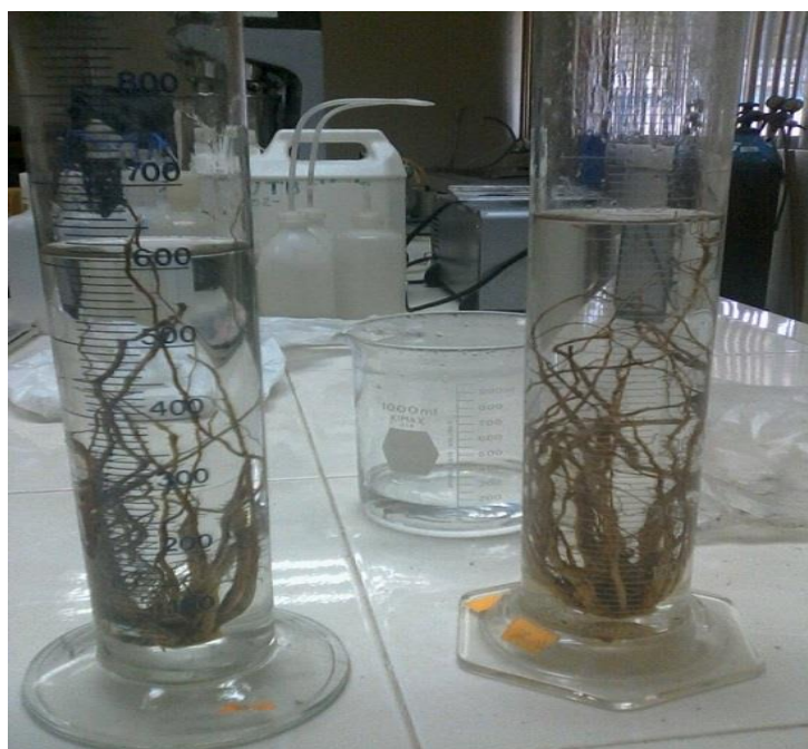
Figuras 7. Determinación de biomasa.