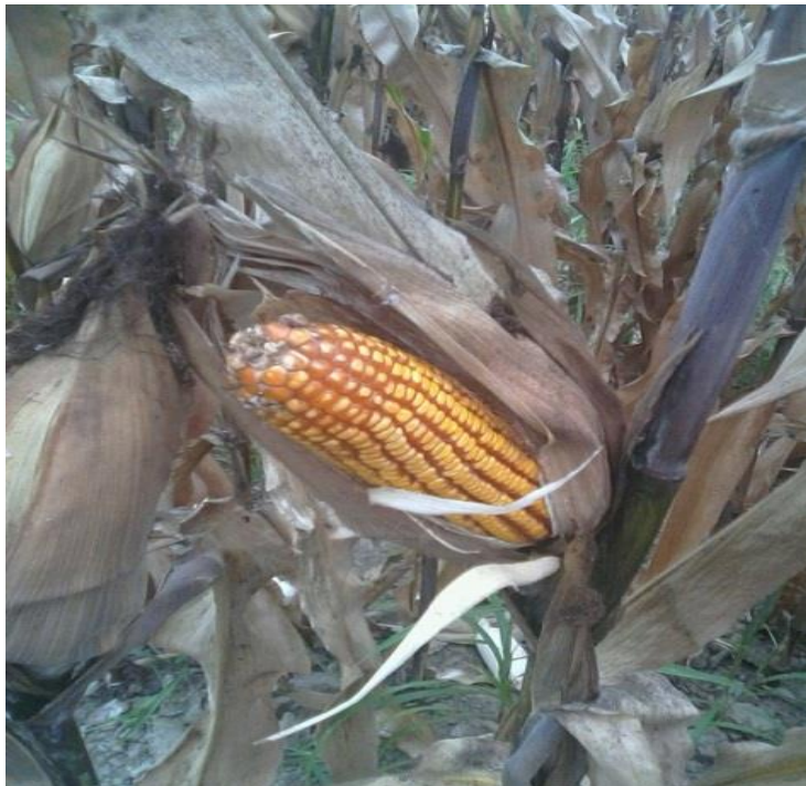
Figura 9. Medición de variables.