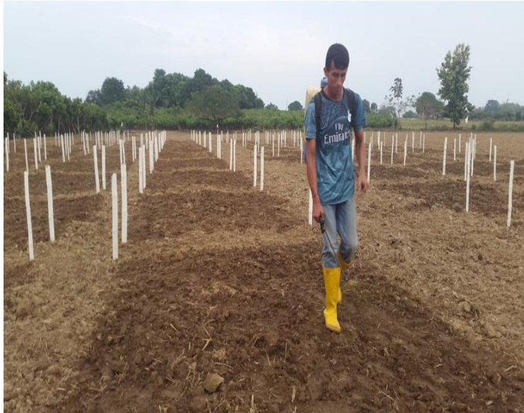
Figura 2. Aplicación de los tratamientos.