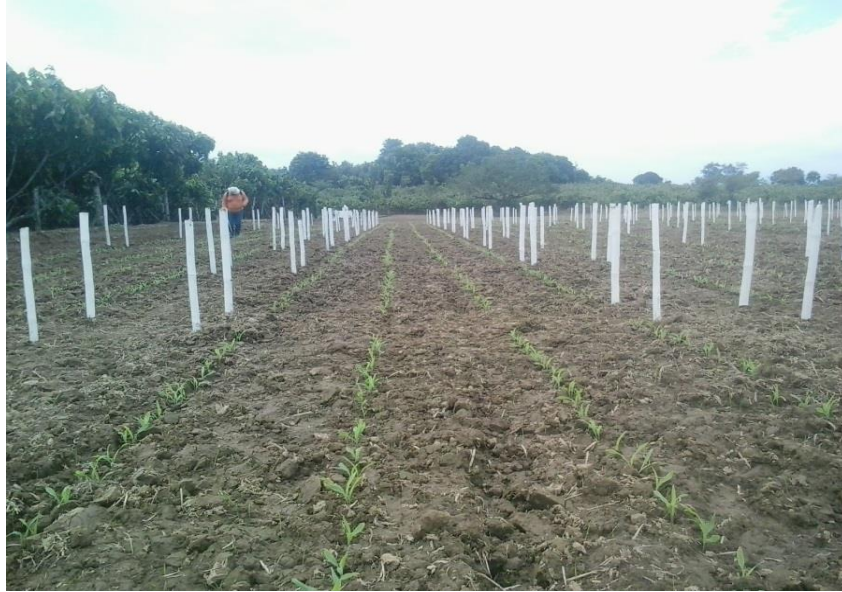
Figura 4. Crecimiento de tratamientos.