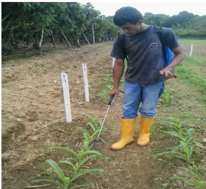
Figuras 6. Control fitosanitario.