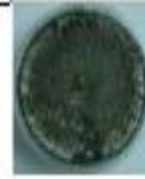
Foto 4. Hongos