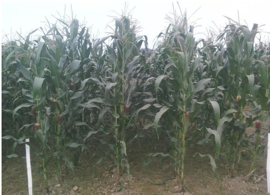
Figura 5. Efectos de los tratamientos.