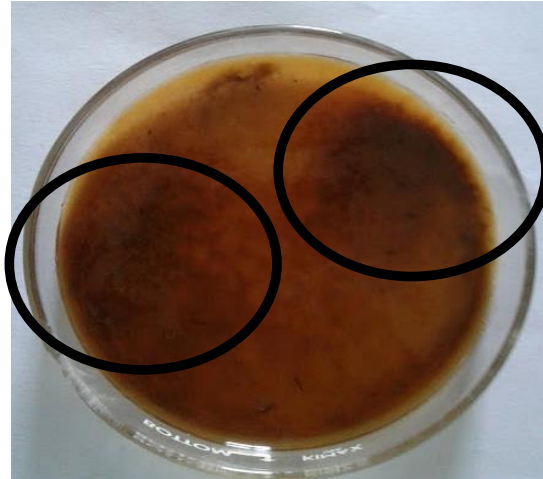
Fig 1. Caja Petri con colonias de Trichoderma spp. 2018.

La figura 1, muestra las colonias de Trichoderma encontradas en las pruebas hechas en laboratorio. Se determinó la presencia del hongo, así como una colonización uniforme en las placas realizadas.