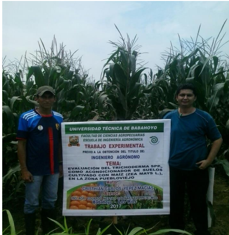
Figura 8. Visita de Director de Trabajo Experimental.