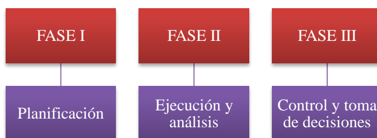
Figura N° 2: Modelo básico de un proceso financiero

Según lo que establece (Terrazas Pastor, 2009) debe de existir un modelo básico sobre lo que respecta al proceso financiero que debe de llevarse dentro de una empresa el cual es el siguiente: