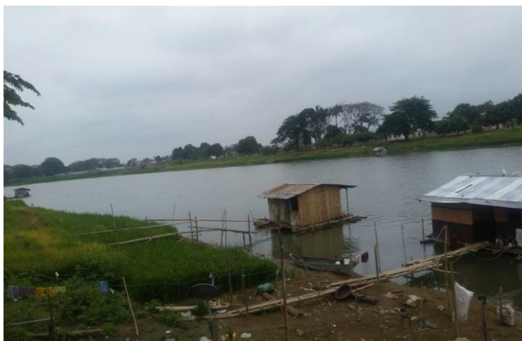
FIGURA N° 4 Riveras del río Babahoyo en total abandono por parte de las autoridades.