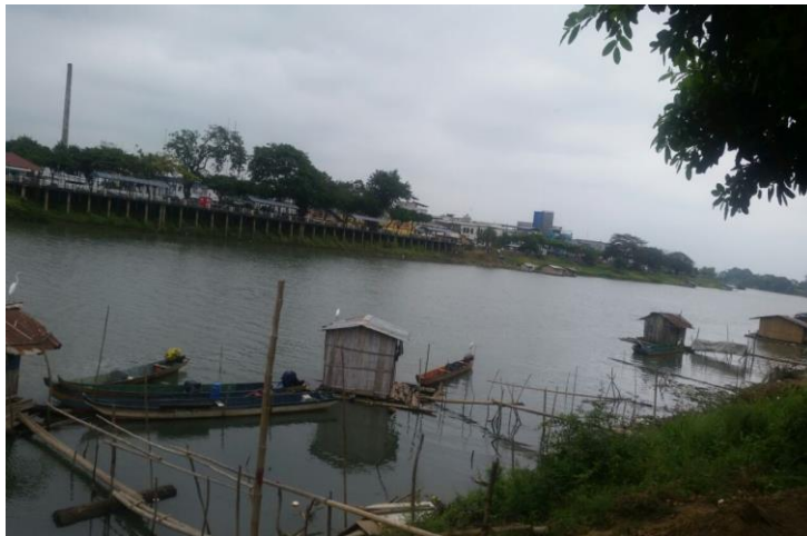
FIGURA Nª 6 vista de la ciudad de Babahoyo desde el sector las Balsas.