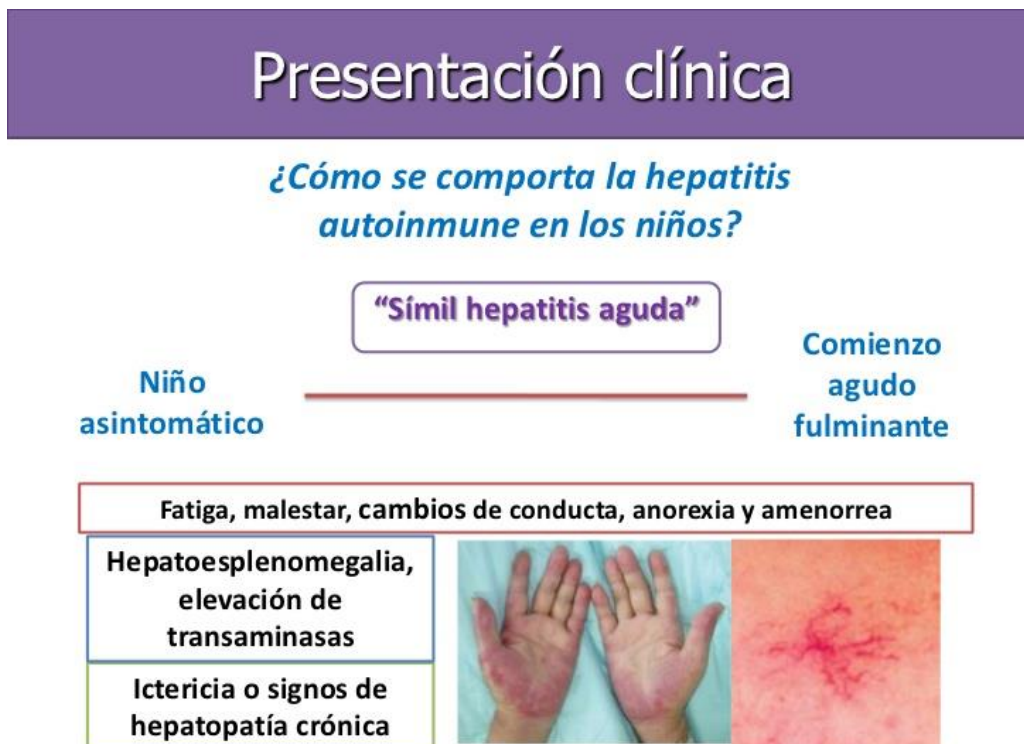
Fig. 2 Presentación Clínica de Hepatitis autoinmune.