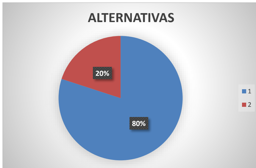
GRÁFICO # 2