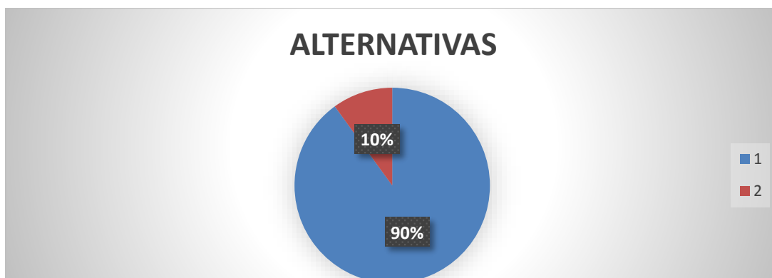
GRÁFICO # 1