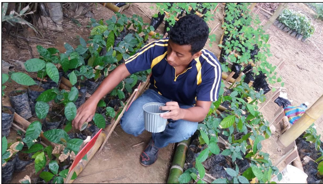
Figura 5. Aplicación de los tratamientos