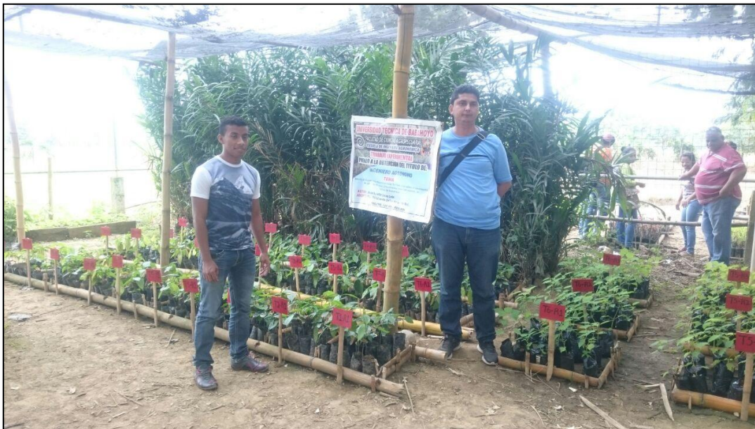
Figura 8. Seguimiento trabajo experimental por parte del asesor