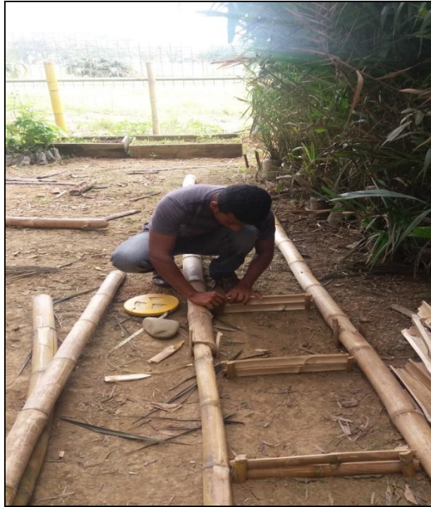
Figura 1. Elaboración de platabandas