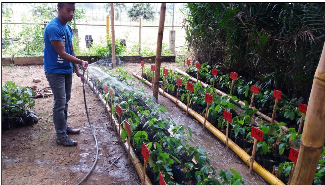
Figura 10. Riego