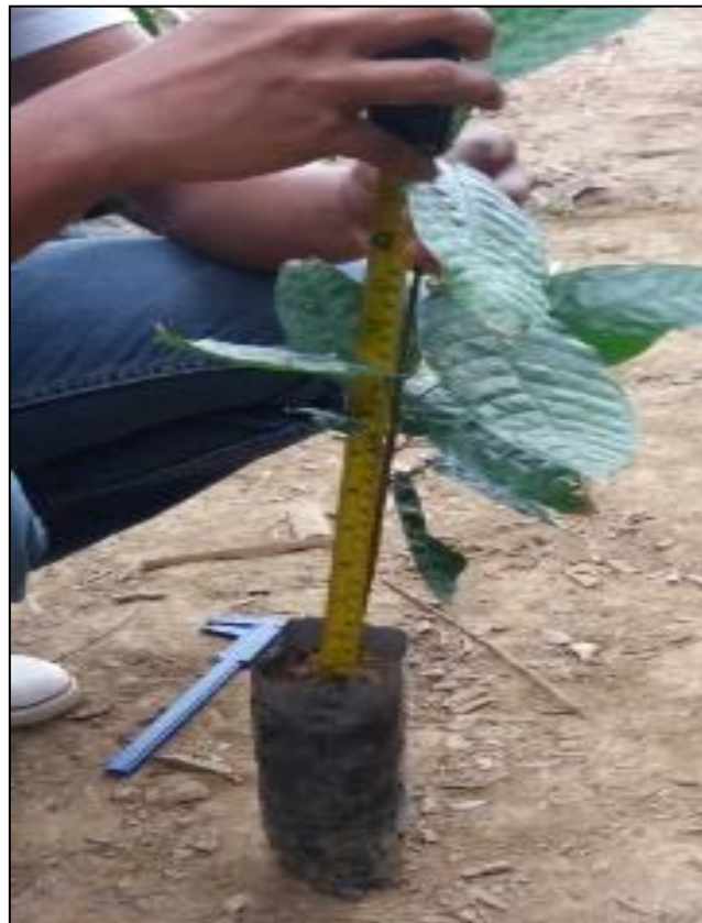
Figura 12. Toma de altura de planta