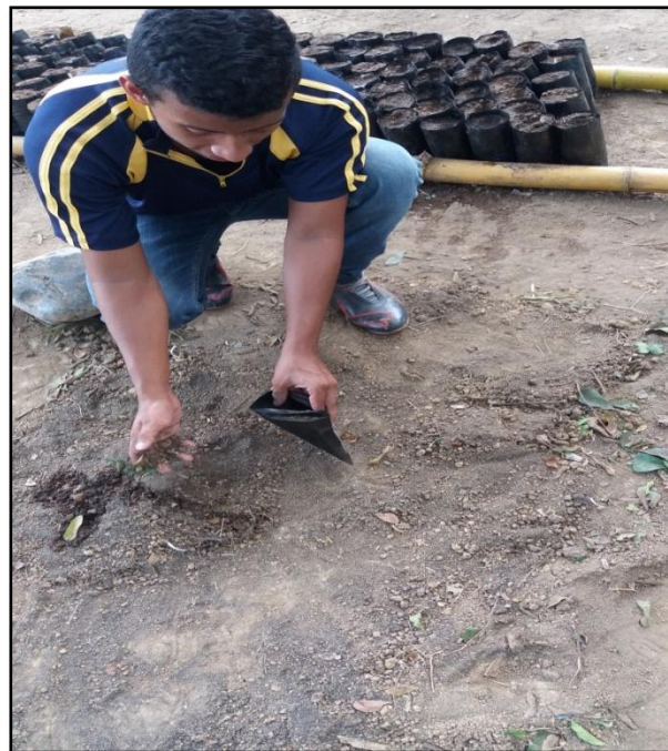
Figura 2. Preparación de sustrato y llenado de fundas