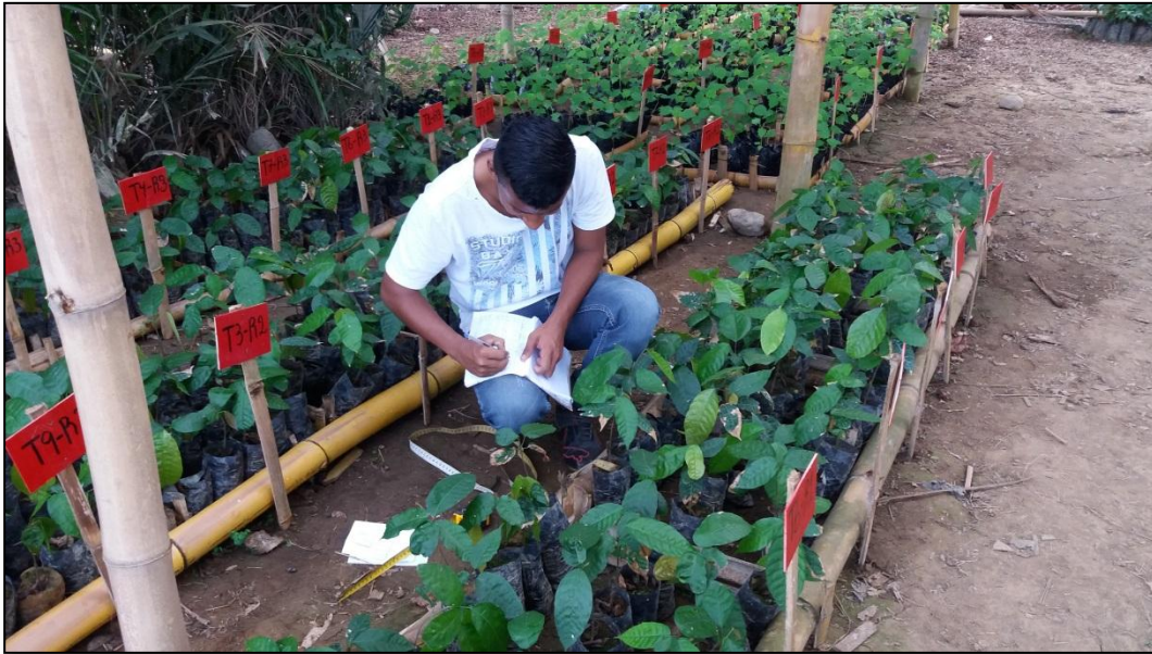
Figura 6. Toma de datos