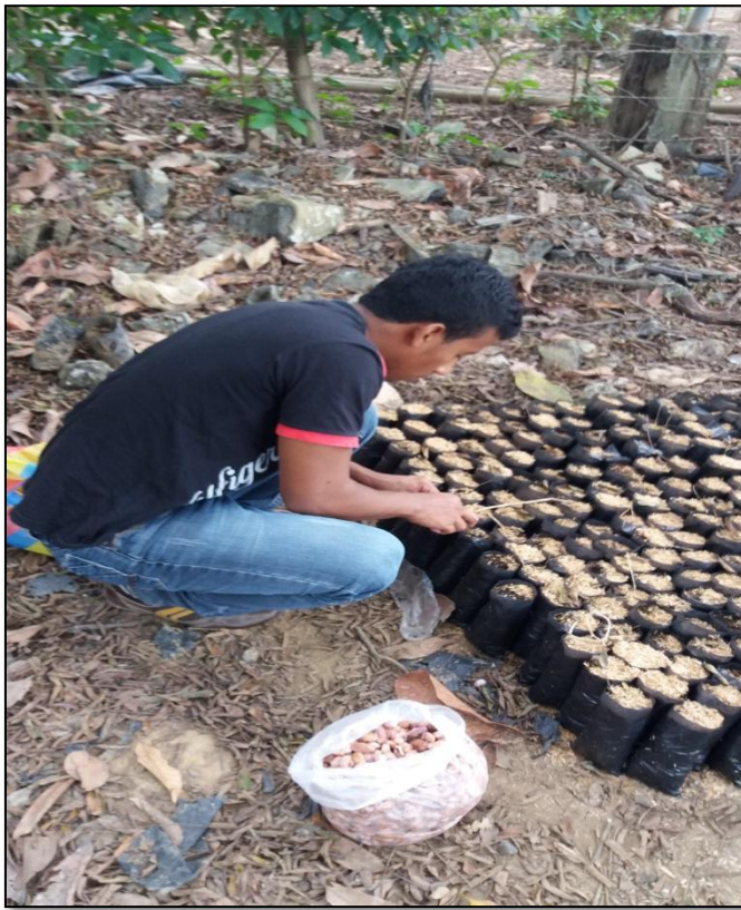
Figura 3. Siembra