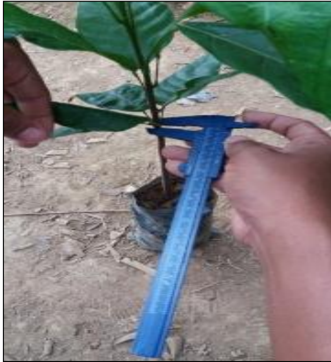
Figuras 11. Toma de diámetro de tallo