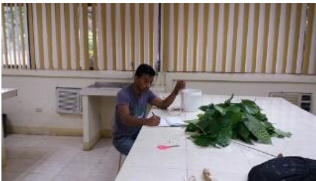
Figura 14. Toma de datos en el laboratorio