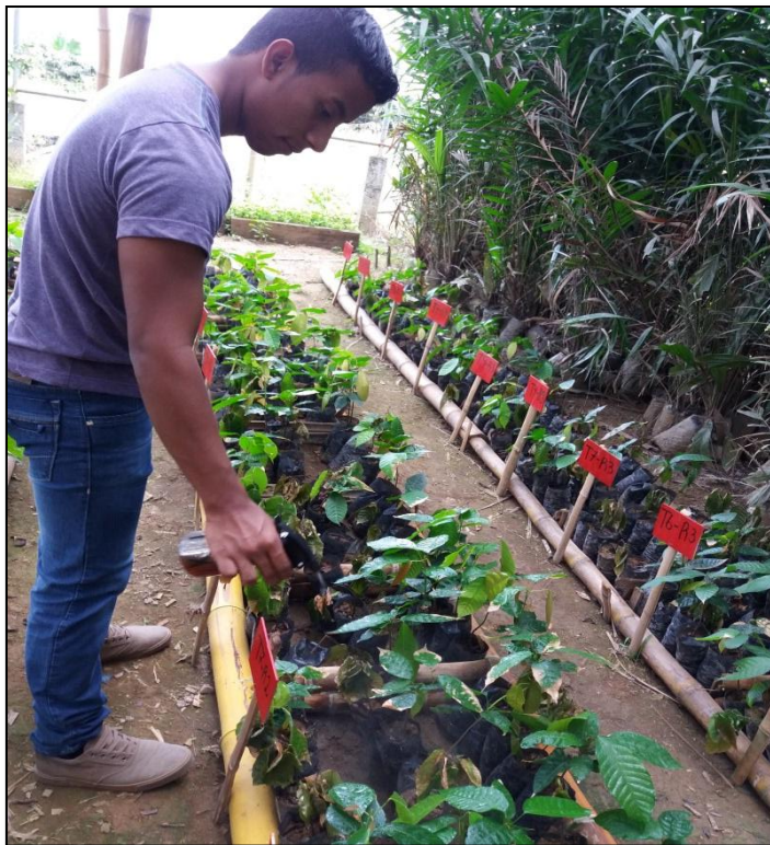
Figura 9. Control fitosanitario