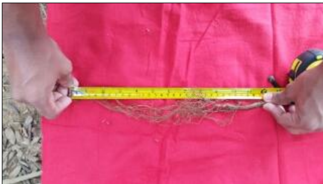
Figura 13. Toma de longitud de raíz