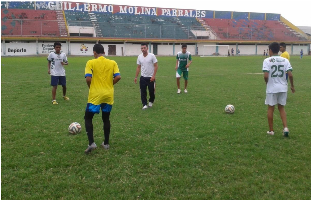
Analizando la ejecución del pase de los deportistas de la sub 12 del club deportivo Venecia+