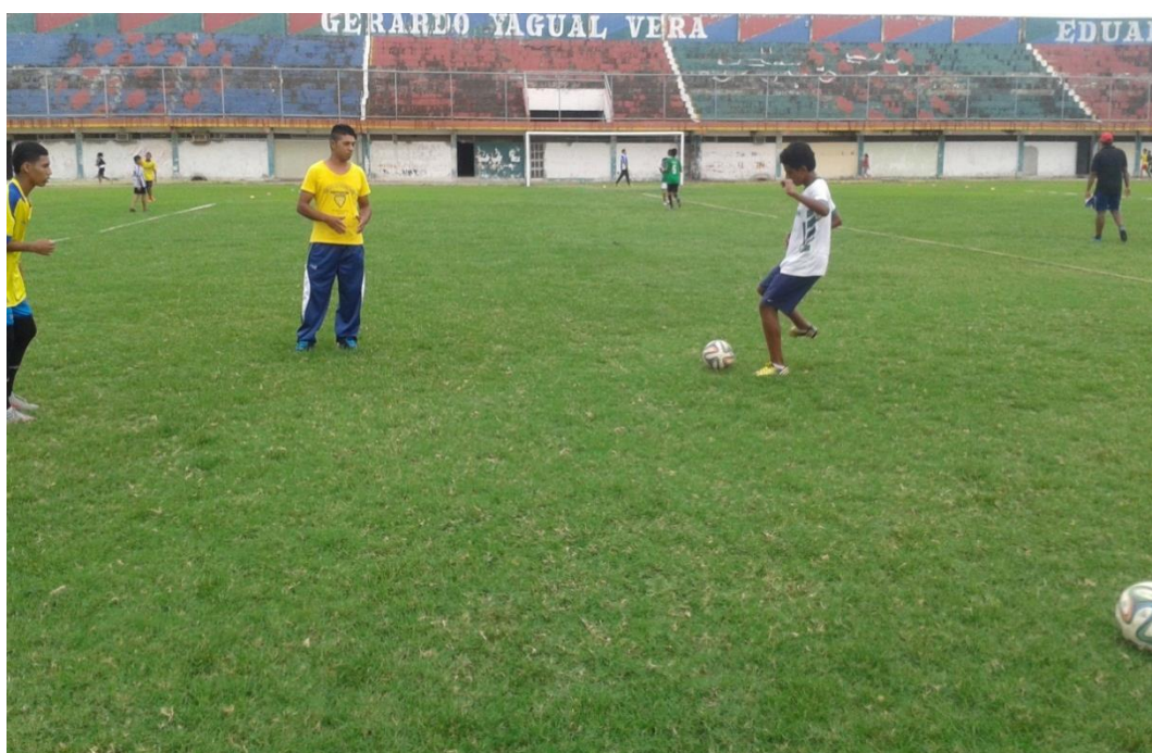
Observando las prácticas de los jugadores del Venecia de la categoría sub-12